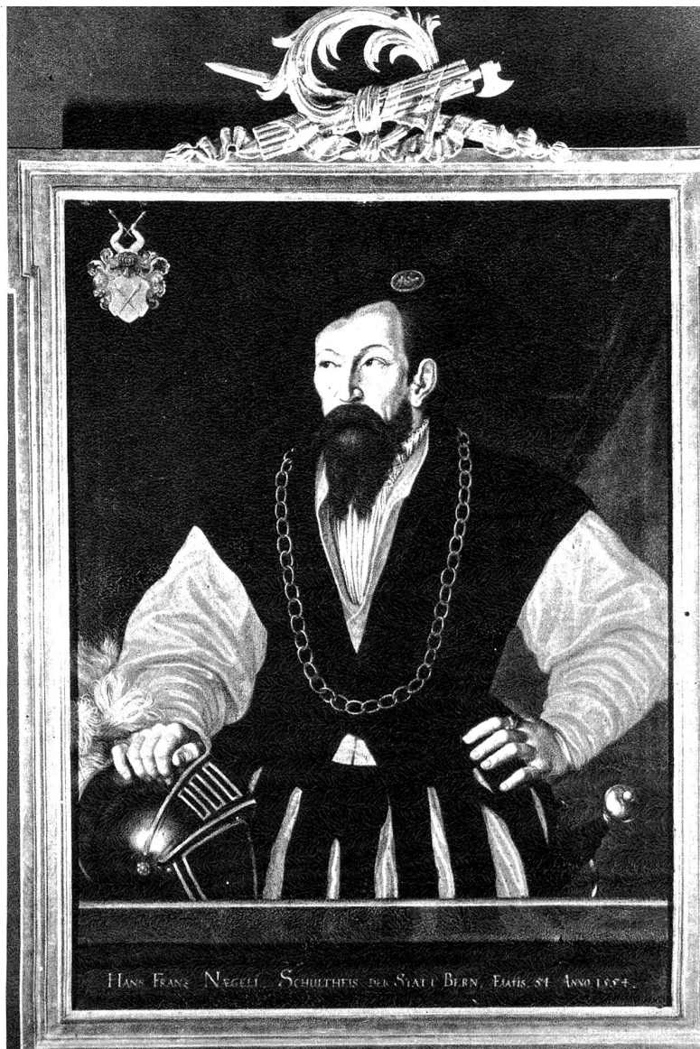
Rechts: Hans Franz Nægeli, der Eroberer der Waadt (1496—1579). Er ist heute noch einer der populärsten Gestalten der bernischen Geschichte. Seiner umsichtigen Kriegsführung ist in hohem Masse die erfolgreiche, rasche und unblutige Eroberung des Waadtlandes, mit welcher Bern seinen grössten Gebietszuwachs erhalten hat, zu verdanken. Während mehr als 40 Jahren war er der einflussreichste Mann in Bern. Er galt auch als einer der reichsten Berner.