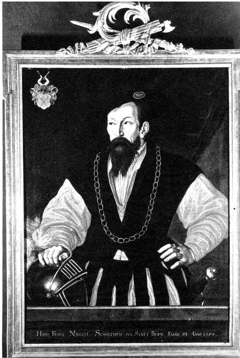
Rechts: Hans Franz Nägeli, der Eroberer der Waadt (1496—1579). Er ist heute noch einer der populärsten Gestalten der bernischen Geschichte. Seiner umsichtigen Kriegsführung ist in hohem Masse die erfolgreiche, rasche und unblutige Eroberung des Waadtlandes, mit welcher Bern seinen grössten Gebietszuwachs erhalten hat, zu verdanken. Während mehr als 40 Jahren war er der einflussreichste Mann in Bern. Er galt auch als einer der reichsten Berner.