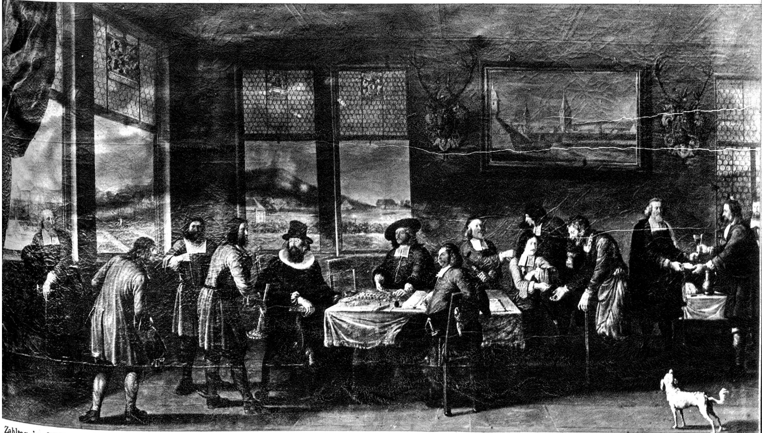
Zahltag im löblichen Bauamt der Stadt Bern. Die Bauherren von Rät und Burgern zahlen den Werkleuten den Arbeitslohn. Das Bild zeigt uns eine der über dreissig Verwaltungskammern des alten Staates Bern in ihrer Tätigkeit.