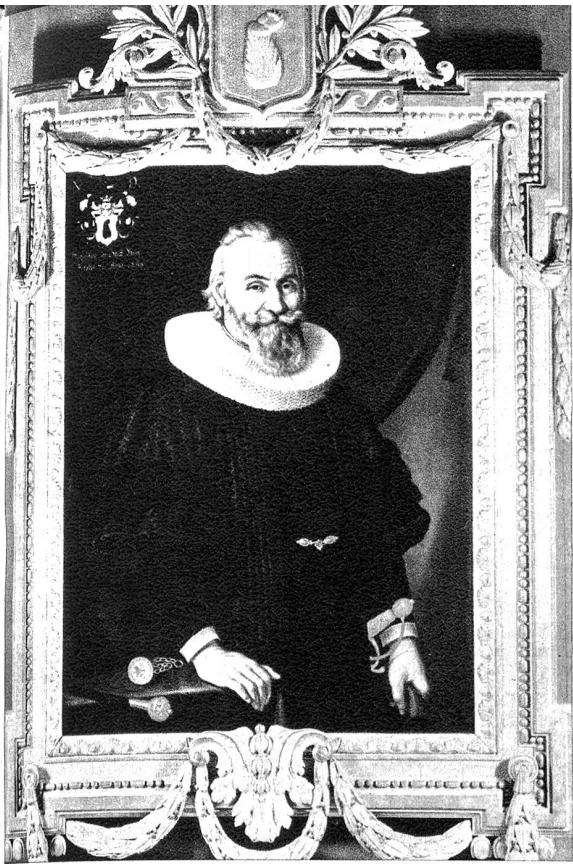
Schultheiss Niklaus Daxelhofer (1595—1670) bekleidete das hohe Schultheissenamt in den Jahren 1636—1668. In den bewegten Zeiten des dreissigjährigen Krieges hat er mit Weisheit, Würde und unbeflecktem Ruf das bernische Staatswesen geleitet. Im Bauernkrieg von 1653 trug seine milde Gesinnung viel zur raschen Versöhnung der politischen Gegensätze zwischen Stadt und Landschaft bei.