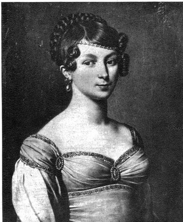
Links: Grossfürstin Anna Feodorowna, geborne Prinzessin Julie Ulricke Henriette v. Sachsen-Coburg-Gotha, die von 1814—1860 in der Elfenau wohnte. Das Bild entstammt aus der Glanzzeit der Elfenau.