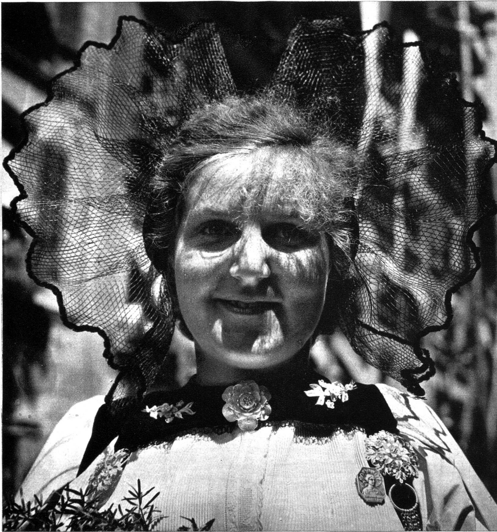
Blondi Chrüseli und lüüchtendi Ouge hei em Bärnfescht erscht der richtig Sinn gä.