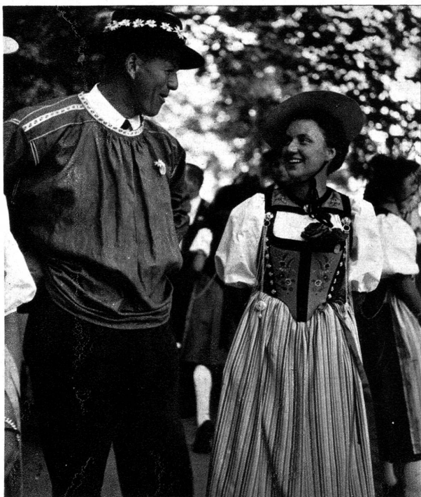
Da gits nüt vo Kumplimänte . . .