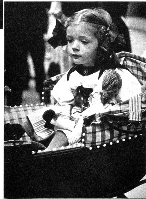
Dem Vatti sys Schätzeli.