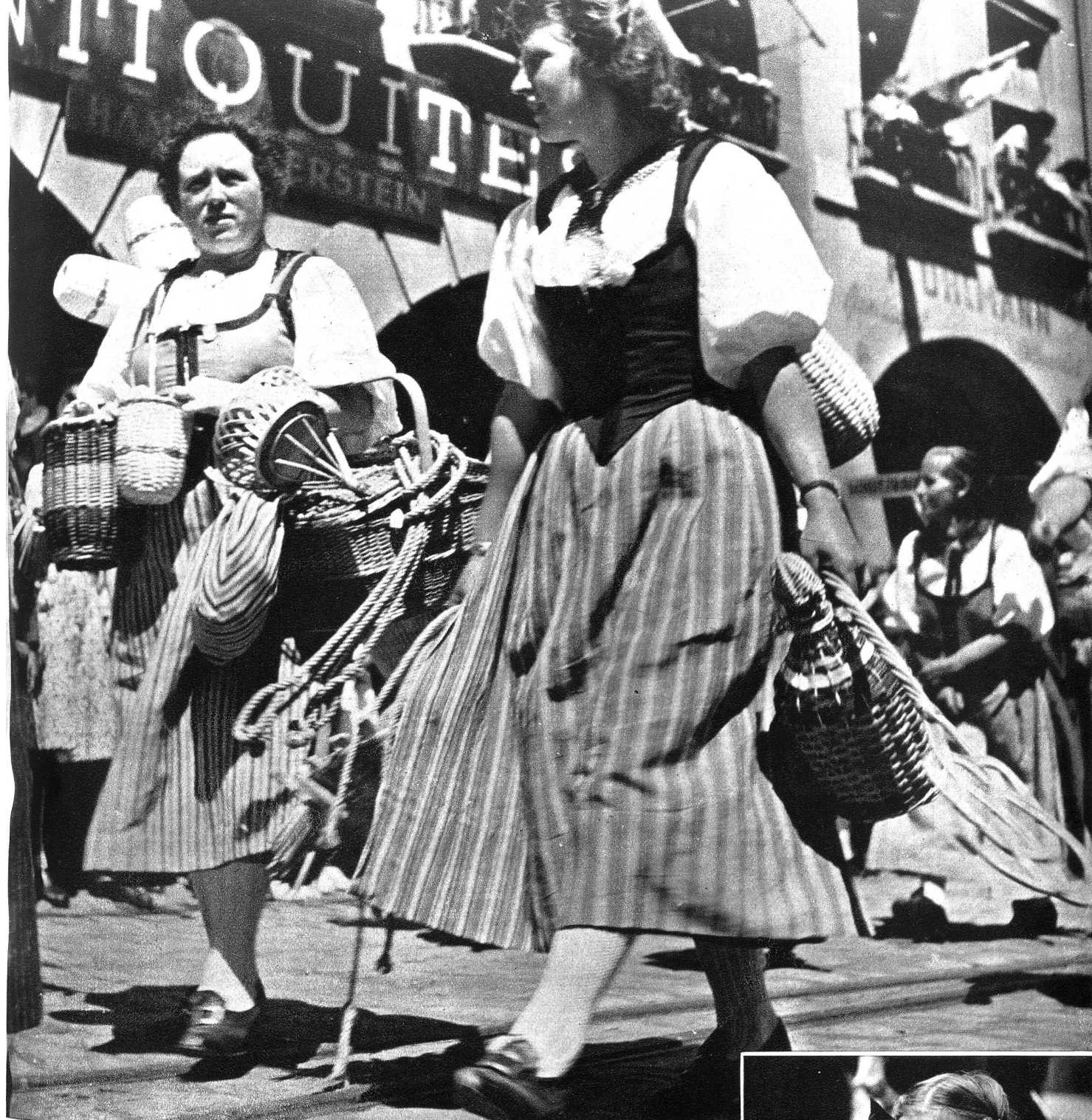
Mir gö ga Burdlef z'Märit . . .