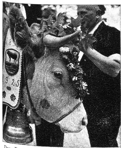
Dem Bur si Stolz