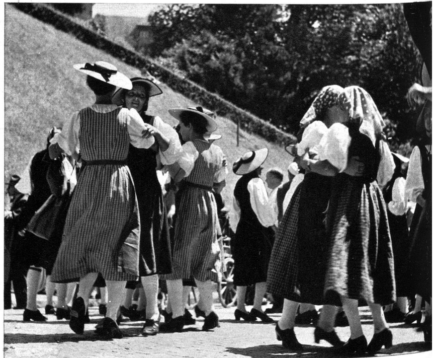
E Ländlerkapälle het afa spiele, da hei die junge Meitschi grad uf dr Strass afa tanze.