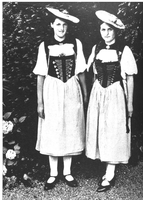
Die neuerdings sehr beliebte Bernertracht nach Freudenberger, mit blauem Rock, rotem Mieder und Silberketten.