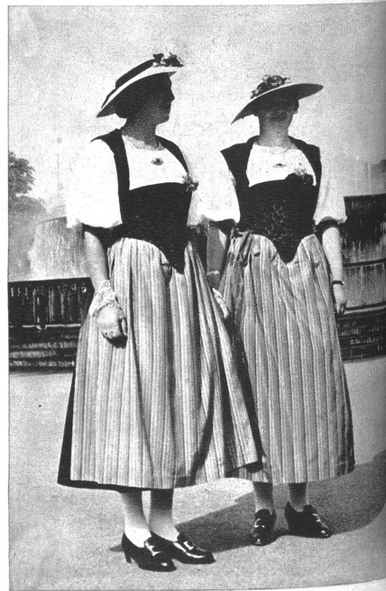
Lengnauerinnen in ihrer schönen Seeländertracht.