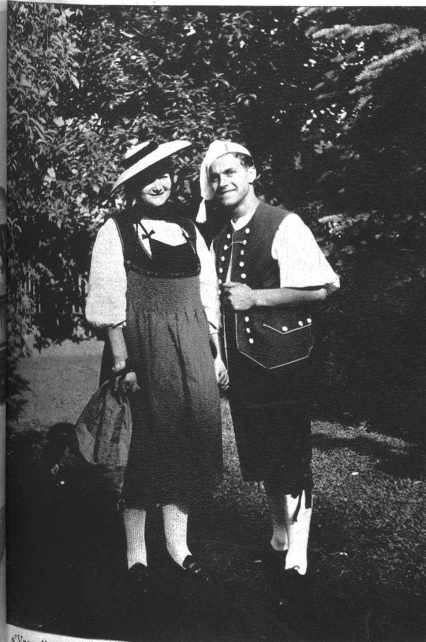
s'Yvetti ab em Guggisbärg . . . ein Guggisberger Pärli in der Sonntags-tracht.