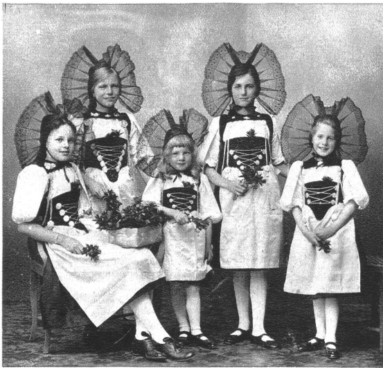
Unsere Sonntags-Berner-Tracht mit der Haube, dem schwarzen Mieder und dem reichen Silberschmuck.