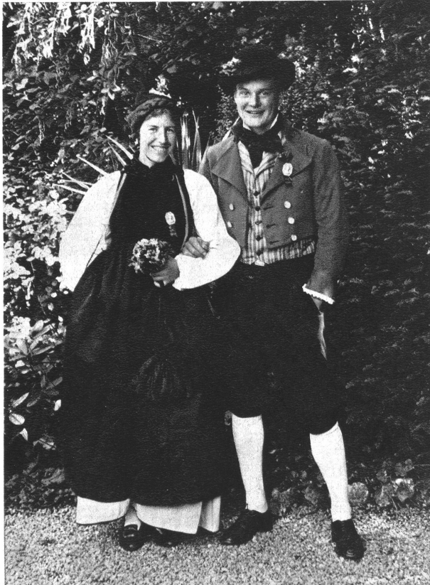
Ein fröhliches Brautpaar aus dem Oberhasli.