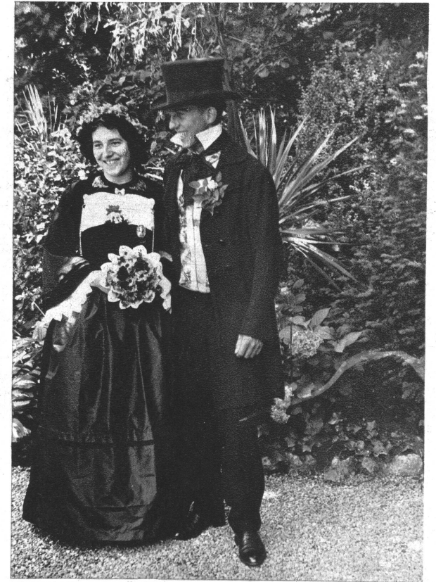
Ein Berner Brautpaar aus der Biedermeier-Zeit.