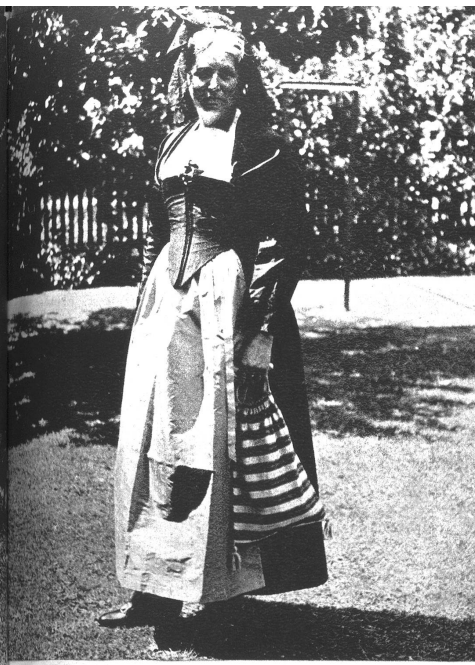
Eine schöne Simmentalerin.