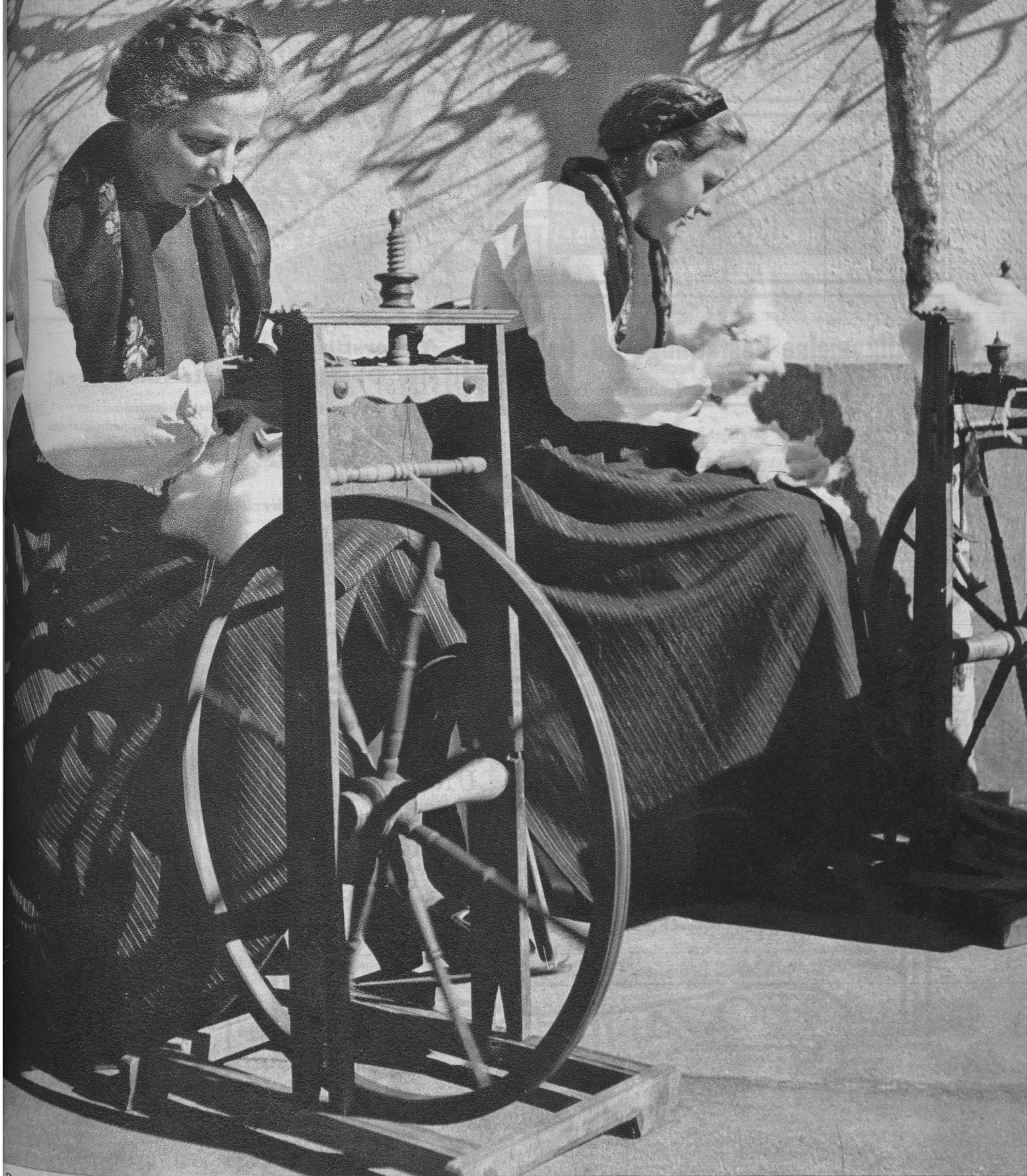
Das Spinnrad dreht sich wieder wie zu Grossmutter's Zeiten.