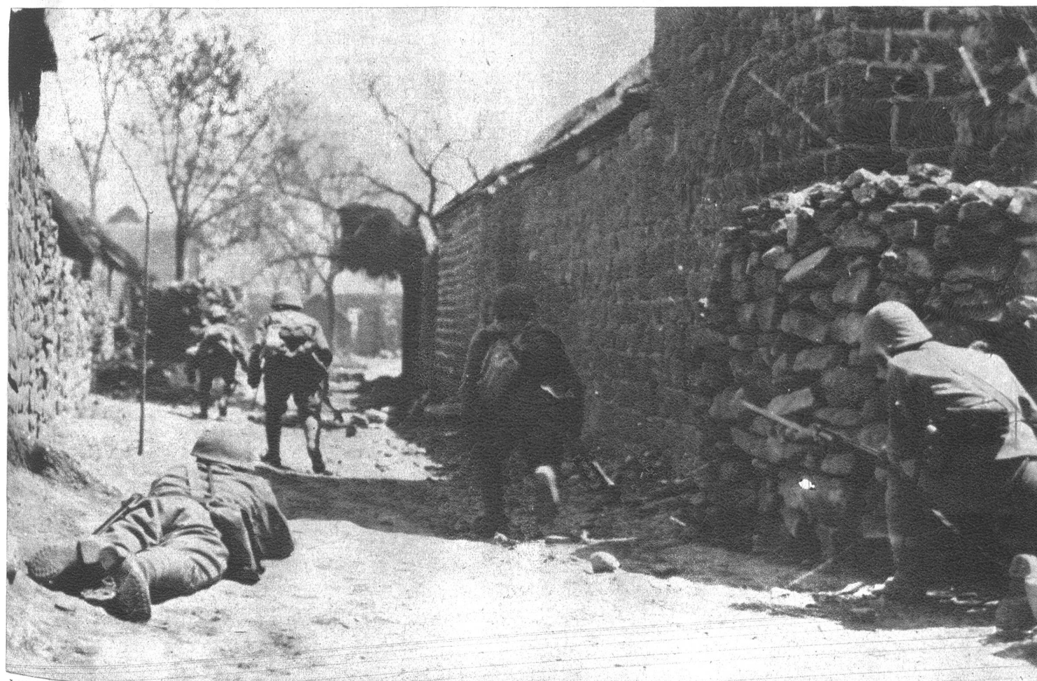
Japanische Infanterie, die in einem Hafen Chinas gelandet ist, stürmt eine von den Schiffsgeschützen zerstörte Ansiedlung.