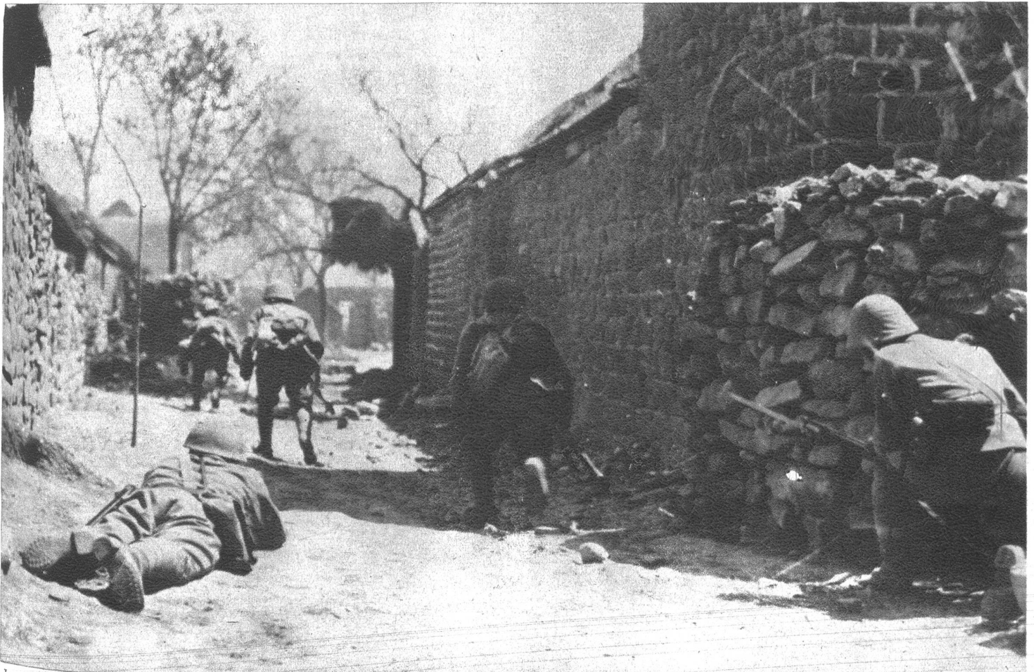
Japanische Infanterie, die in einem Hafen Chinas gelandet ist, stürmt eine von den Schiffsgeschützen zerstörte Ansiedlung.