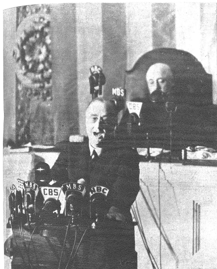
Präsident Roosevelt der Vereinigten Staaten von Nordamerika fordert energische Hilfe für England und warnt vor dem fernen Osten.