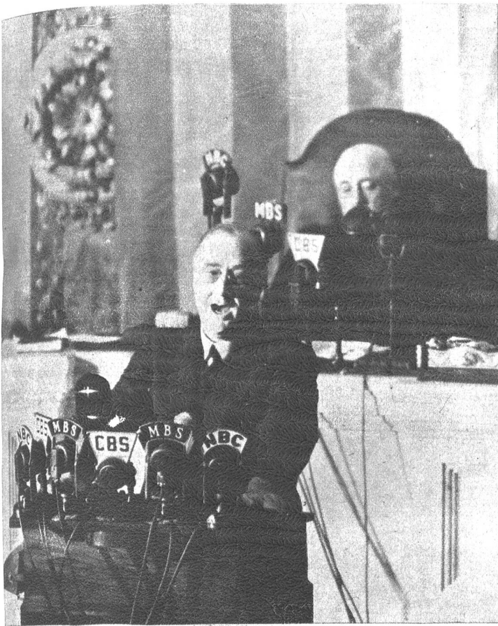
Präsident Roosevelt der Vereinigten Staaten von Nordamerika fordert energische Hilfe für England und warnt vor dem fernen Osten.