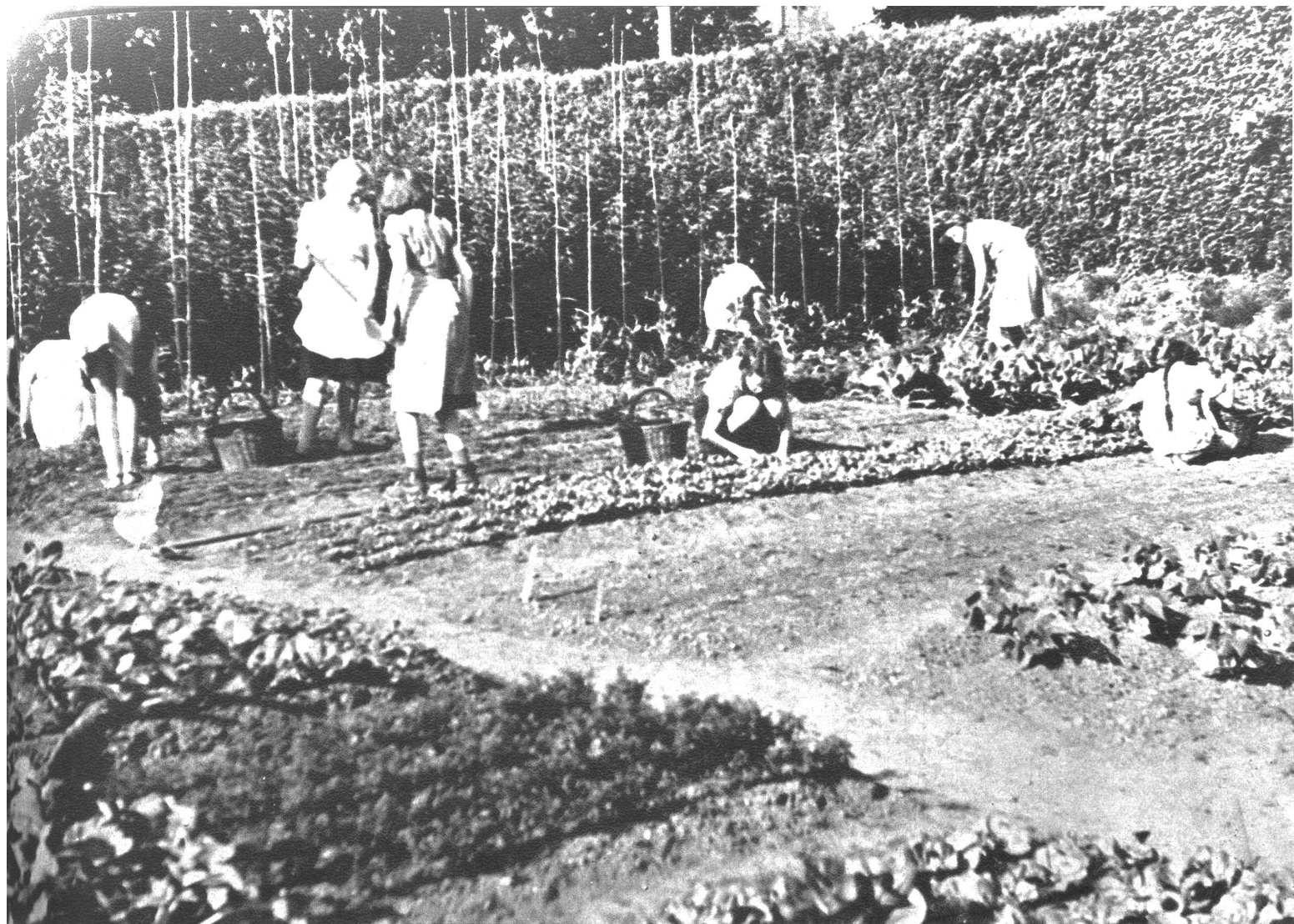
Alles ist eifrig beim Jäten, denn unser Garten soll auch immer fein ordentlich und sauber aussehen.

Im Ablauf des Bächleins wachsen Schilf und gelbe Schwertlilien zwischen den Himbeerhecken. Die Giesskanne musste dort in Sicherheit gebracht werden, weil sie einen Rest Düngelösung oder Schädlingsbekämpfungsmittel enthält, die den Kindern nicht ohne Instruktion in die Hände fallen darf.