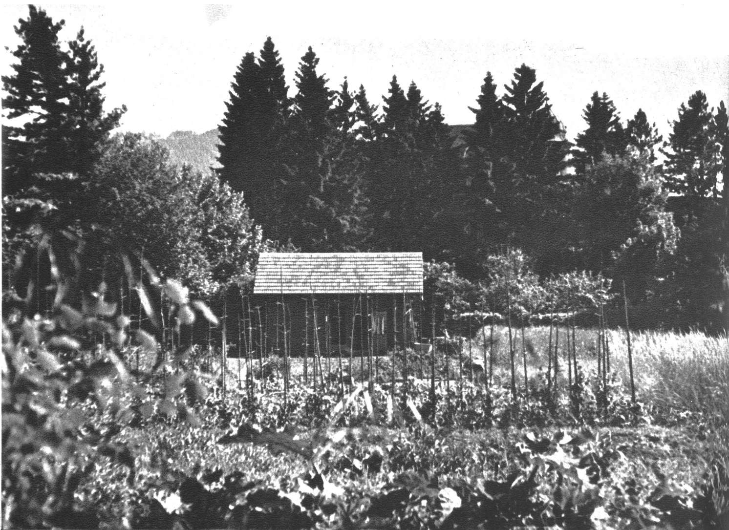
Gesamtansicht des Schülgartens. Würde man glauben, dass sich dieses Grundstück mitten in der Stadt befindet? Die Bäume der Nachbargärten, die üppige Heumatte und das wallende Kornfeld muten uns ländlich an.