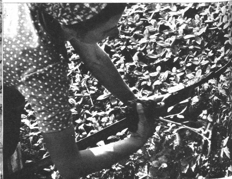
Mit gutem Wurzelballen macht die Gärtnerin den Tomatensetzling zur Pflanzung bereit.