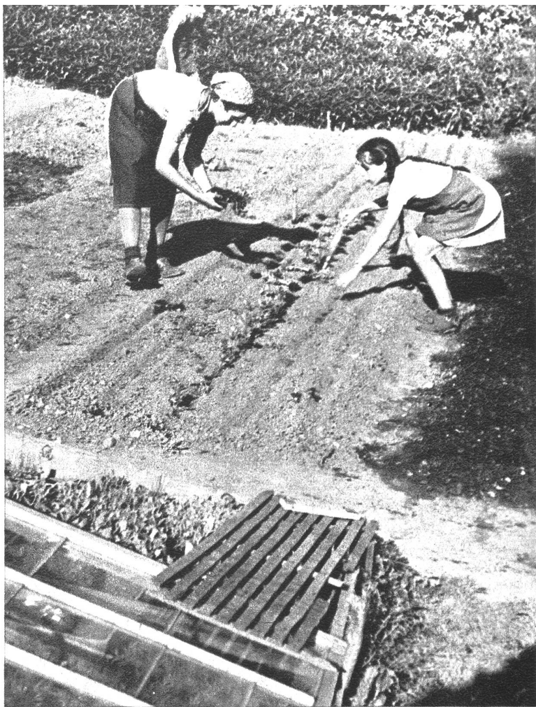
Reihen und Pflanzlöcher sind im Beet genau abgemessen und werden nun mit Sorgfalt bepflanzt. Für kurze Kinderarme ist die Arbeit in der Mittelreihe oftmals ein kleines turnerisches Kunststück.