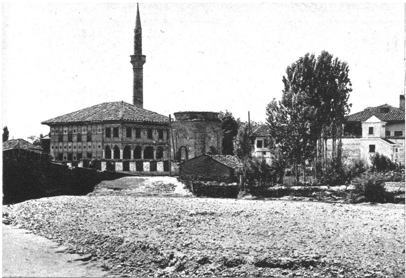
Tetovo, ein wichtiger strategischer Punkt in der Richtung Skoplje—albanische Grenze.