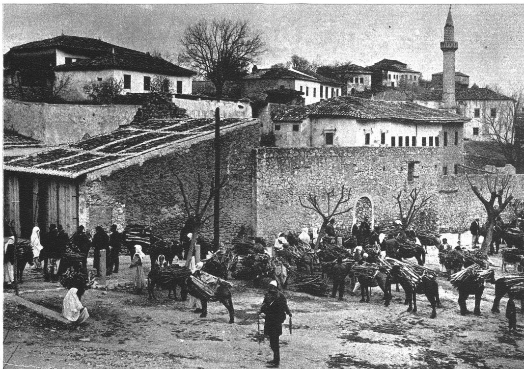
Südserbische Stadt an der albanischen Grenze.