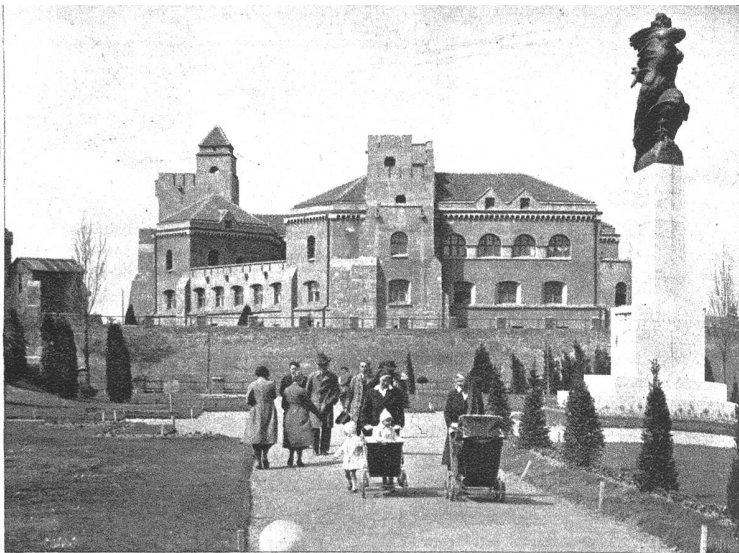
Die alte Festung in Beograd mit dem Freiheitsdenkmal von Mestrovic.