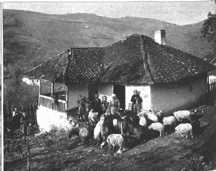
Bauernhaus in Südserbien.