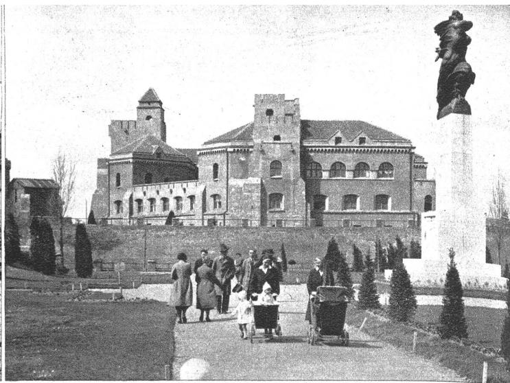
Die alte Festung in Beograd mit dem Freiheitsdenkmal von Mestrovic.