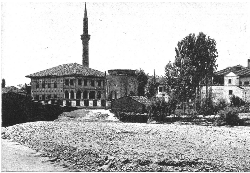
Tetovo, ein wichtiger strategischer Punkt in der Richtung Skoplje—albanische Grenze.