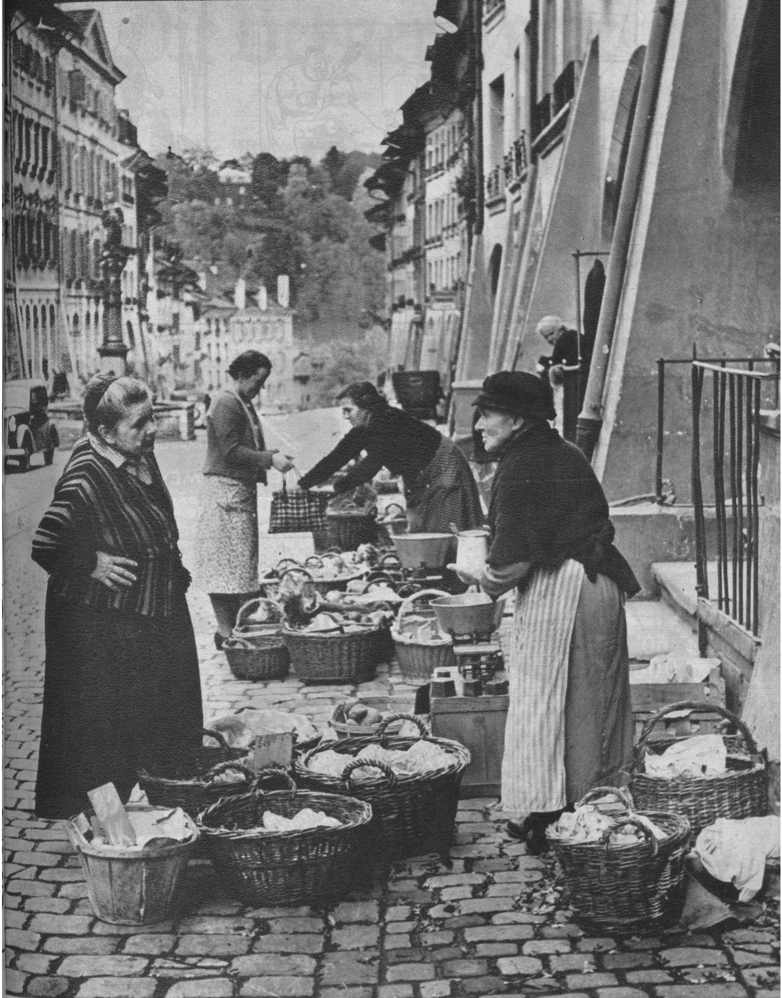
Markt an der Gerechtigkeitsgasse.