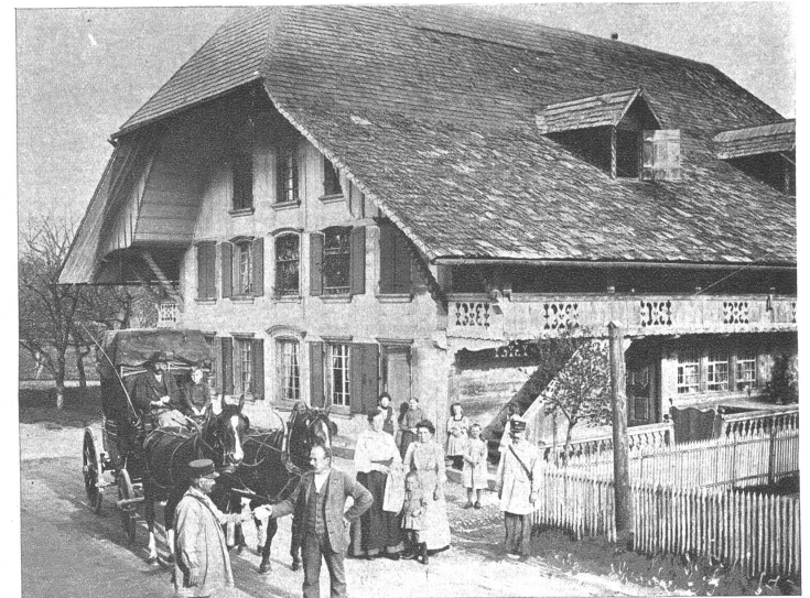
Die letzte Post in Dürrenroth im Jahre 1913. Die meisten der Speicheraufnahmen wurden vor 30 und mehr Jahren gemacht. Vieles hat sich seither verändert.