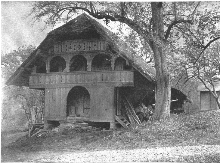
Speicher im Stalden bei Eriswil aus dem Jahre 1754. Eine gedrungene, breite Form des Speicherbaues, wie sie in dieser Gegend üblich ist. Man beachte die harmonische Aufteilung der Fläche durch die wohlproportionierten Laubenbogen und den Bogen über dem untern Eingang.