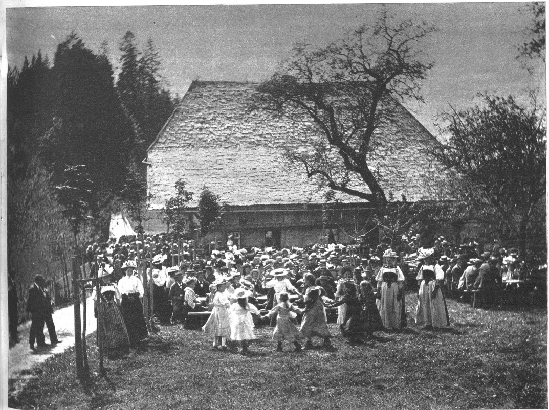
Eine Dorfchilbi in Oberwald ob Dürrenroth vor 30 Jahren.