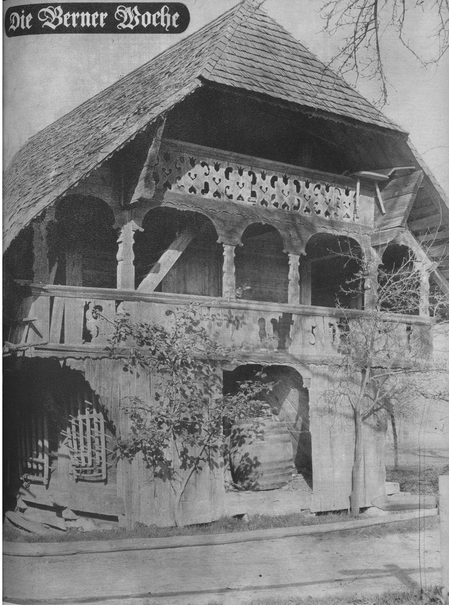
Speicher in Dürrenroth mit charakteristischen Laubenausschnitten. (Zum Bildbericht „Die schönen Speicher im Untereimmental und Oberaargau“ von Albert Stumpf)