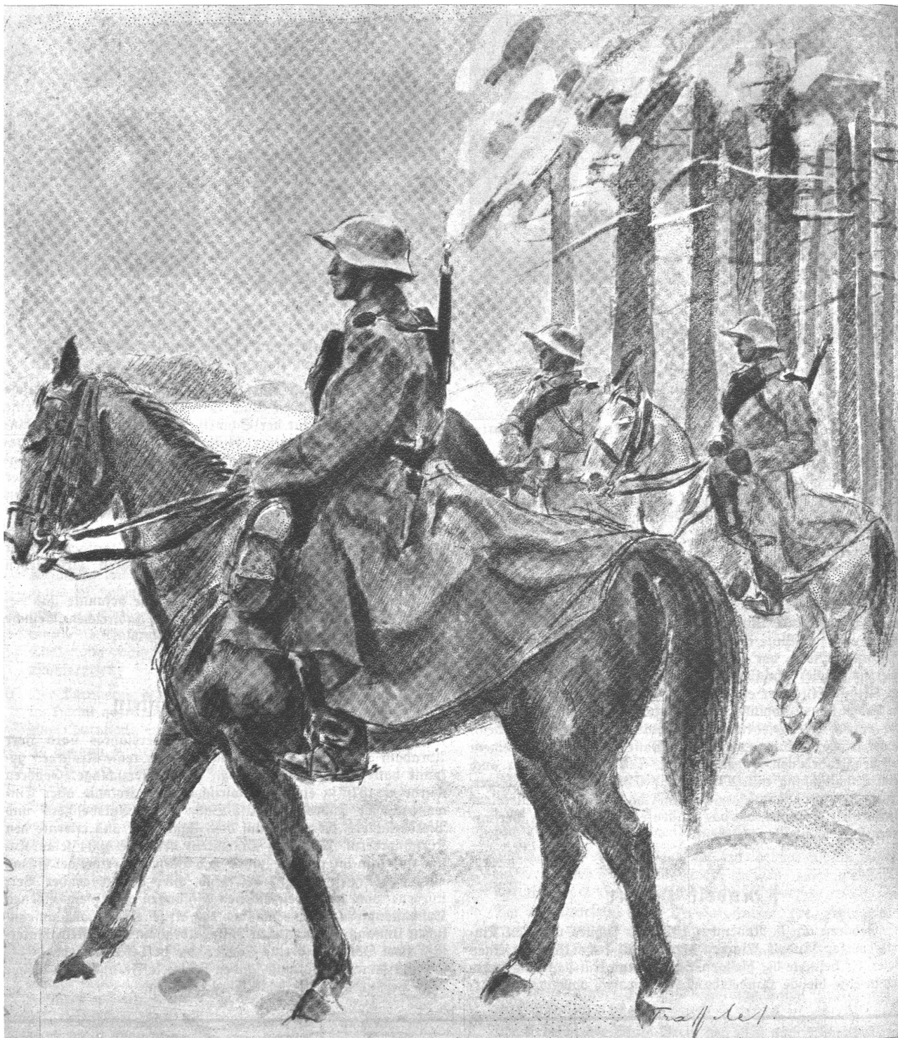
Kavallerie-Patrouille. Bild zum Monat Februar, aus dem prachtvollen Monatskalender mit Militärbildern von Fritz Traffelet, Bern, erschienen im Verlag W. Zbinden, Bern, und vorbildlich gedruckt von der Polygraphischen Gesellschaft Laupen.