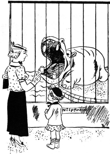
Da siehst du, wie hässlich es aussieht, wenn man gähnt und die Hand nicht vor den Mund hält.