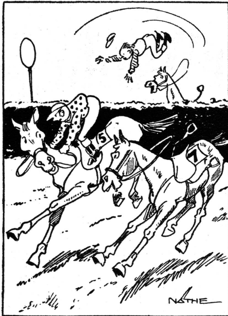
„Meinen spare ich mir für den Wassergraben auf . . .“