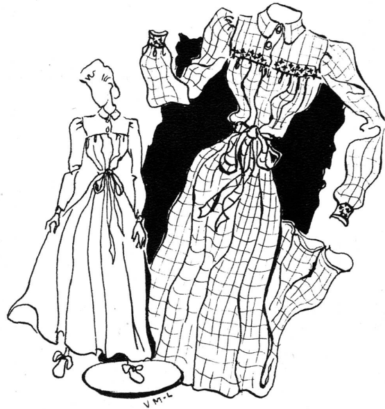
Das Nachthemd für kühle Nächte aus Flanelle oder Barchent, mit Kreuzstich an der Passe ausgarniert. Der alte bäuerliche Stil wirkt hübsch und jugendlich. Das Material ist in alter Manier gemustert.