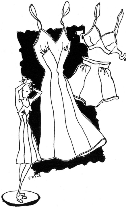
Eine Wäsche Garnitur aus Seide und mit einem Zierstrich aus- garniert.