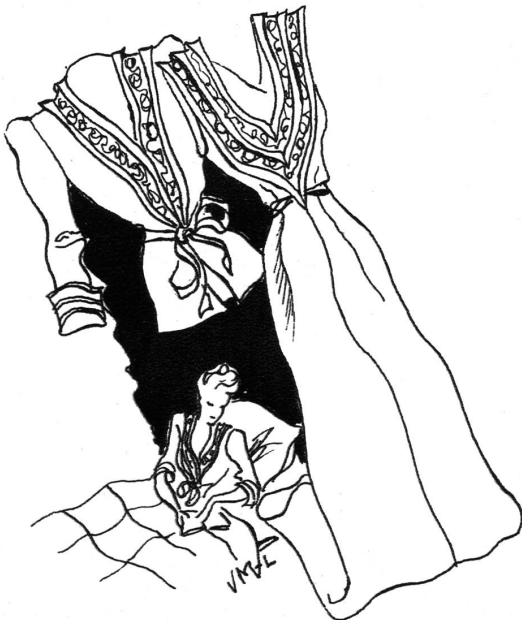
Ein Nachthemd aus Satinseide mit dazupassender Liseuse. Eine von Hand angefertigte Bändchengarnitur verschönert beide Stücke.