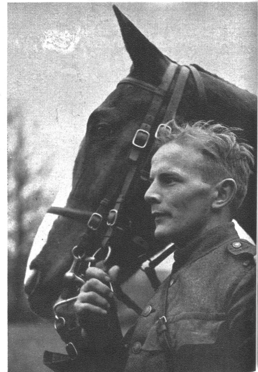
Zwei gute Kameraden . . . III 1986 He