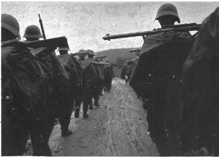
Bei Nebel und Regen III 1990 He