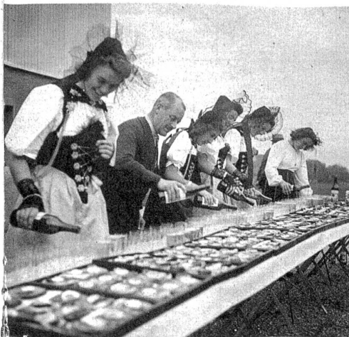
Auf dem neuen Sportplatz, auf welchem das abgesagte Eidg. Turnfest 1940 hätte stattfinden sollen, kredenzt die Stadt Bern den Gästen einen Willkommtrunk.