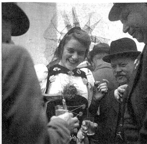
Von zarter Hand und aus fröhlichem Herzen überreicht schmeckt ein Willkommtrunk doppelt gut!