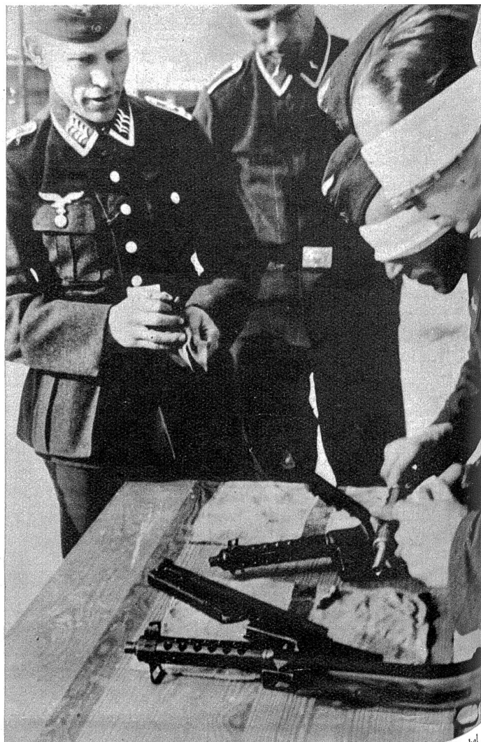
„Ihr müsst die Knarre im Schlaf bedienen können“, sagt der Feldwebel — und mit verbundenen Augen nehmen die Soldaten die Maschinenpi- stole auseinander und setzen sie auch wieder genau zusammen.