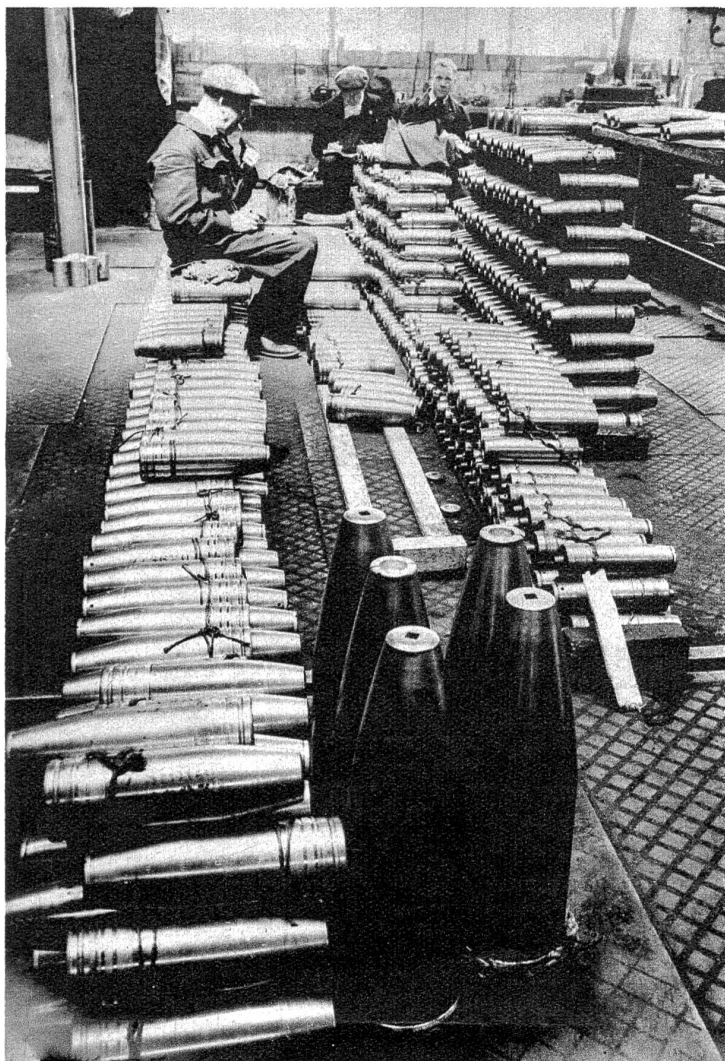
„Gemütliche“ Zwischenverpflegung in einer Munitionsfabrik in England, in denen Tag und Nacht ohne Unterbruch gearbeitet wird.