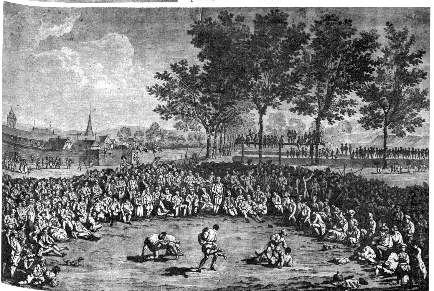
Ostermontagschwingfest auf der Kleinen Schanze in Bern (um 1810), jenes Schwingfest, von dem Gotthelf einmal berichtete: „Am Ostermontag läuft, wer noch laufen mag, vor das obere Tor, dem Schwinget zuzusehen. Dort schwingen die Oberländer und Emmenthaler gegen einander und eifern um den höchsten Preis: . . . Wo die Landeskraft am grössten sei, darum wird gerungen, und es ist wirklich schön, mit welchem Ernste und in bestimmten Formen der feste Emmenthaler und der flinke Oberländer um die Ehre ringen“.

Unser Nationalturnen: im Vordergrund übt einer Weitsprung ohne Anlauf, hinter ihm ist einer am Steinstossen, zwei weitere sind wohl Schnell-Läufer, nach den fliegenden Haaren zu schliessen, die aber merkwürdigerweise Arm in Arm laufen, und ganz im Hintergrund, hinter den drei Zuschauern, zwei Schwinger. Diese Zeichnung, eine Illustration in der Luzerner Bilderchronik des Diebold Schilling, die im Jahre 1513 niedergeschrieben wurde, ist die älteste Darstellung des Schwingens, wie auch unserer übrigen nationalen, volkstümlichen Sportarten. — „Will üsi Alte brav heigschwunge, so isch's nen ou bim Chriege glunge“, heisst ein altes berndeutsches Sprichwort.