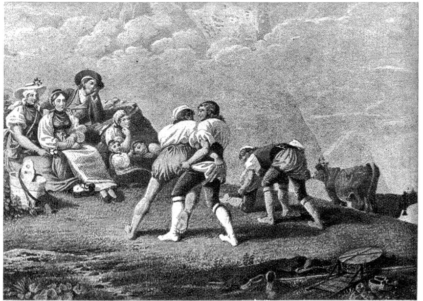
Aelplerschwinget, nach einem Original von G. Lory Sohn (1784—1846).