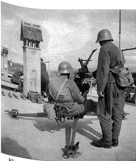
Fliegerabwehrgeschütz in Stellung auf einem Flachdach.