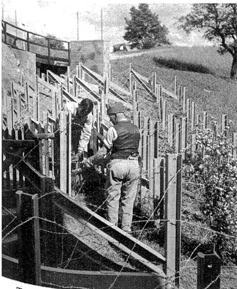
Tanksperrung aus Eisenbahnschienen in einem Villenviertel. III 1590 — He

Kampf gegen Rebläuse? Nein, eine Betontanksperrung wird im Spritzverfahren getarnt.