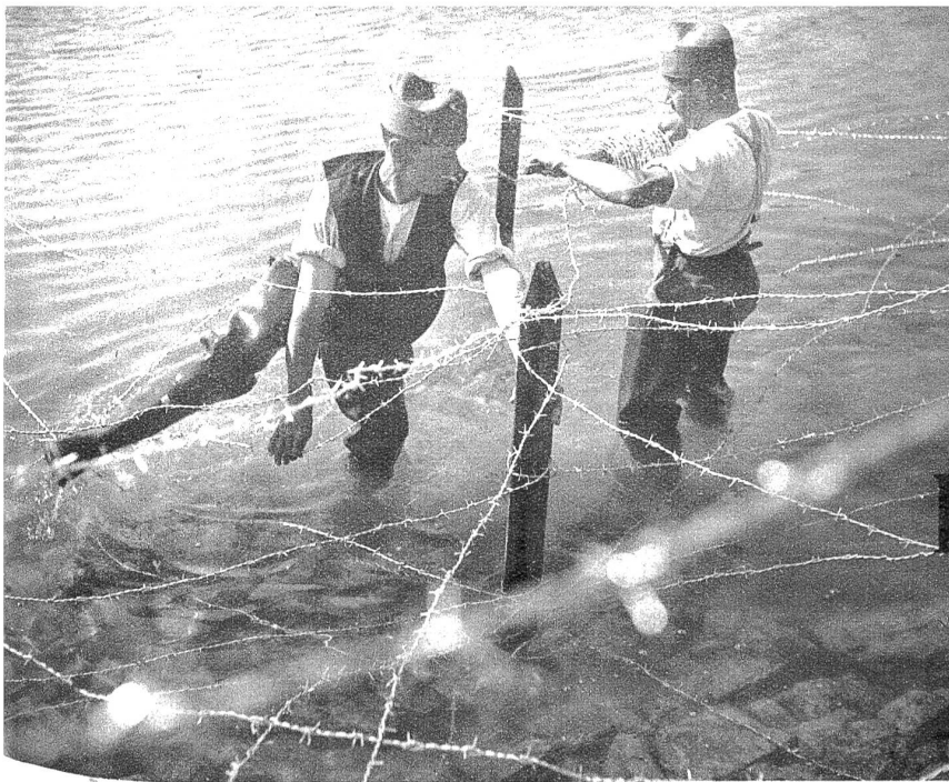
Territorialsoldaten errichten eine Sperre an einem Seeufer zur Verhinderung der Landung von Wasserflugzeugen.