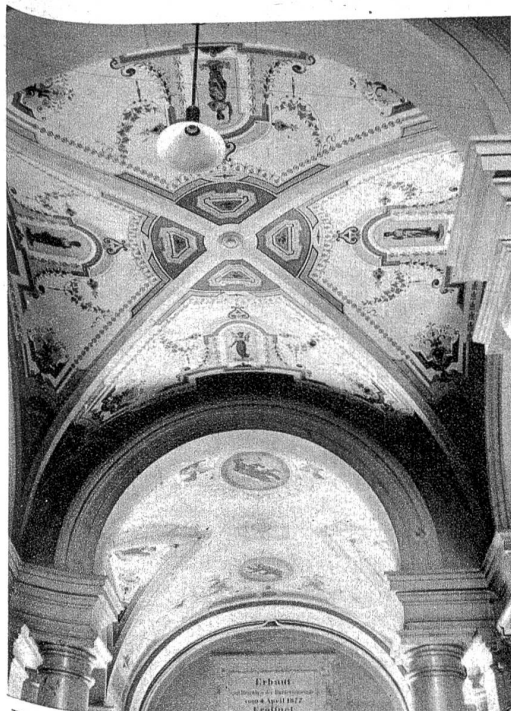
Die Decke über dem Eingang