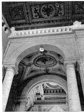
Der Ausgang zum grossen Saal