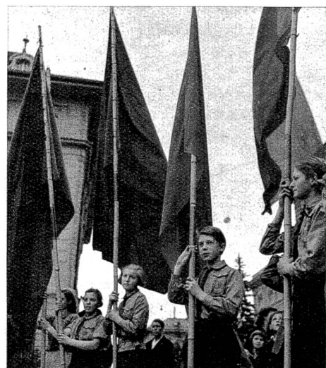
Die Sturmflaggen der Roten Falken.