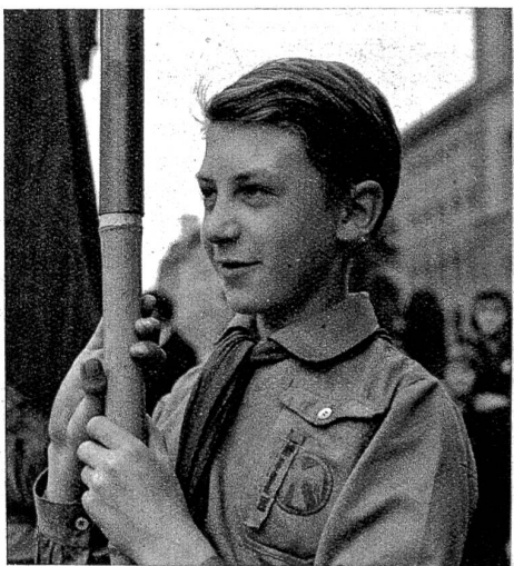
Sie und Er von den Roten Falken.