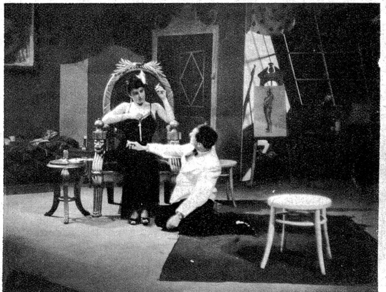
In ihrer Gefühlsverwirrung ist Ninon ins Atelier des Kunstmalers Lenchen (Alfred Lohner) geraten, der ihr statt einer Liebeswerbung seine Geldnöte vorträgt.