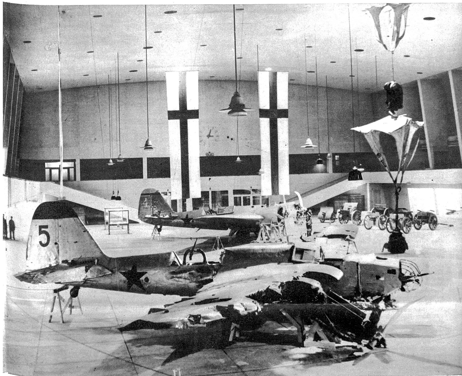
Abgeschossene russische Flugzeuge in einer Ausstellungshalle in der finnischen Hauptstadt Helsinki.