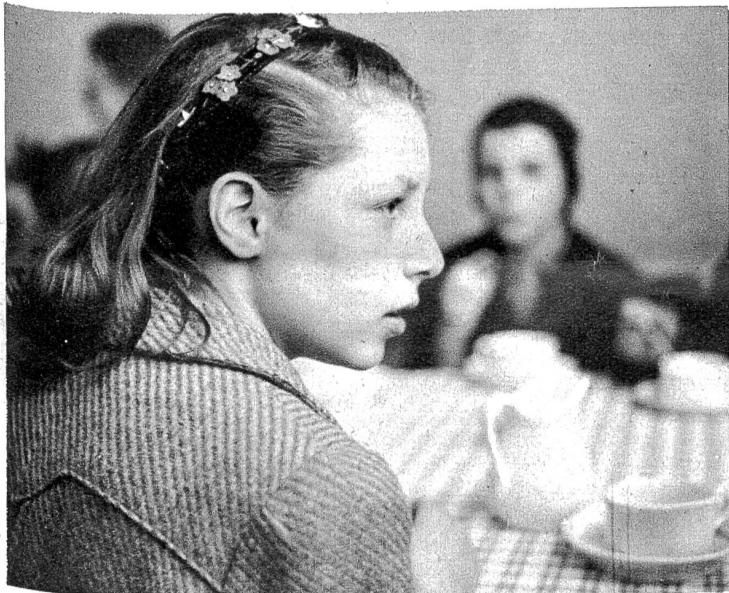
Wie bei den Grossen: Kaffeetischgespräche sind immer höchst ernsthafter Natur.