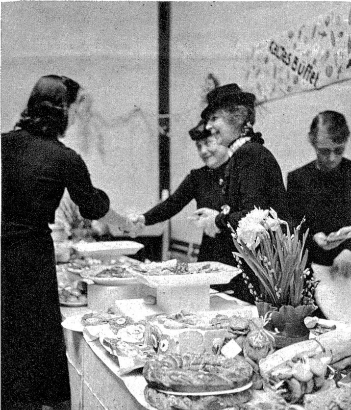
Für leibliche Genüsse war reichlich gesorgt. Auf langen Tischen waren ganze Berge guter Sachen aufgestellt.