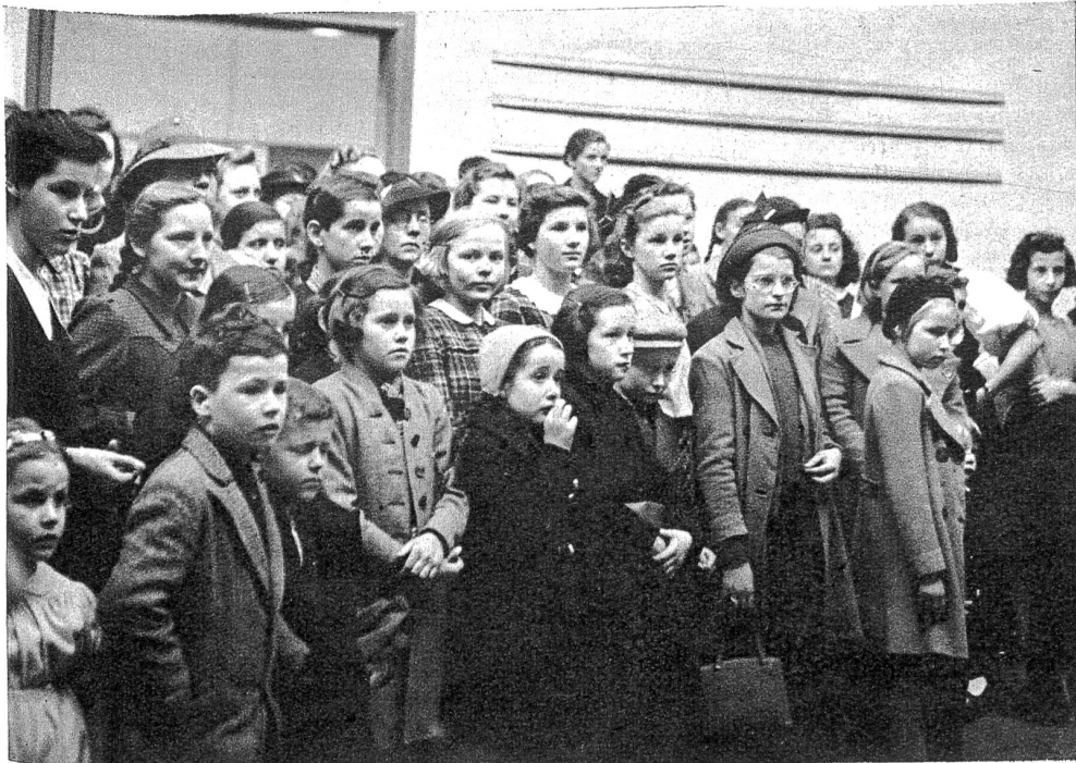
Aufmerksam und mit Spannung folgen Gross und Klein den Darbietungen der jungen Schauspielerinnen, die vom bösen Gessler und der Gründung des Eidgenossenbundes berichten.