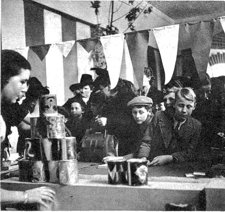
Fröhlicher Schiessbudenbetrieb. Einmal so recht nach Herzenslust mit Ballen auf Blechbüchsen zu pfeffern ist grade das Richtige für Buben