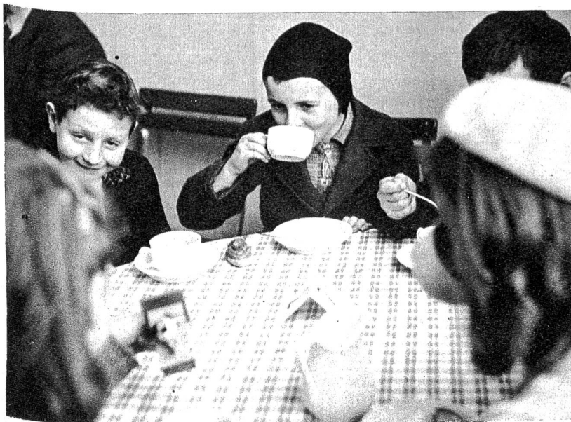
Ein fröhliches Tischkränzchen