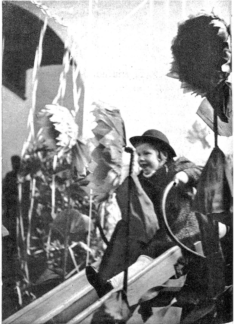
Eine richtige Rutschbahn für die ganz Kleinen mitten im Märchenblumengarten.