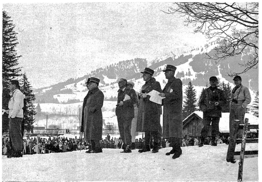
Hohe Militärs unter den Zuschauern.