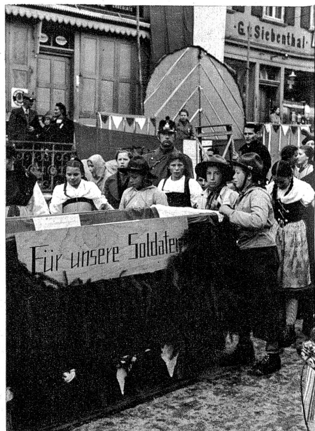
Der Sammelschlitten, der von der Gstaader Jugend herumgeführt wurde und einen sehr schönen Ertrag abwarf.

Es ist ein besonders guter Gedanke, unsere Sportler und Sportbegeisterten auf eine solche Weise auf unser nationales Hilfswerk hinzuweisen und für die gute Sache vorzuspannen. Wenn irgendwo, dann darf gerade unter Sportlern restlose Bereitschaft und Solidarität für eine grosszügige Hilfeleistung an die vom Schicksal hart betroffenen Wehrmänner vorausgesetzt werden.