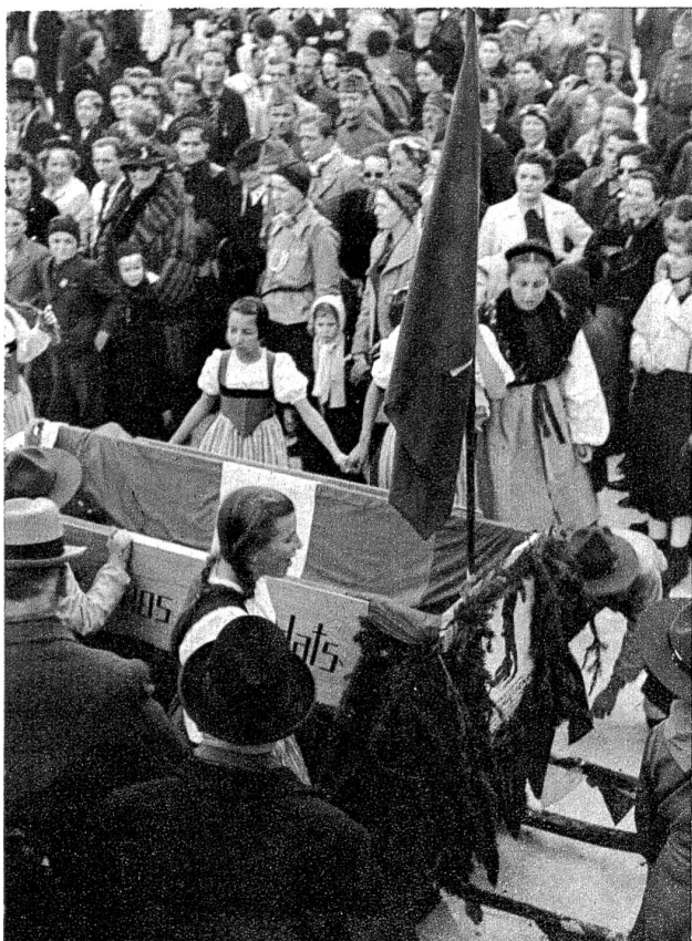
Von allen Seiten prasselten die Geldstücke in die Kiste des Sammelschlittens.

Das Schweiz. Skirennen 1940 in Gstaad stand unter der Devise: „Für unsere Soldaten“. Von jedem Mittagessen, das ohne Ausnahme aus Suppe und Spatz bestand, wurden je zwei Franken an die Nationalspende abgegeben. In einem farbenfrohen Umzug der Gstaader Jugend wurde ein Sammelschlitten herumgeführt, der ebenfalls einen ganz schönen Betrag für die Soldatenhilfe eintrug.