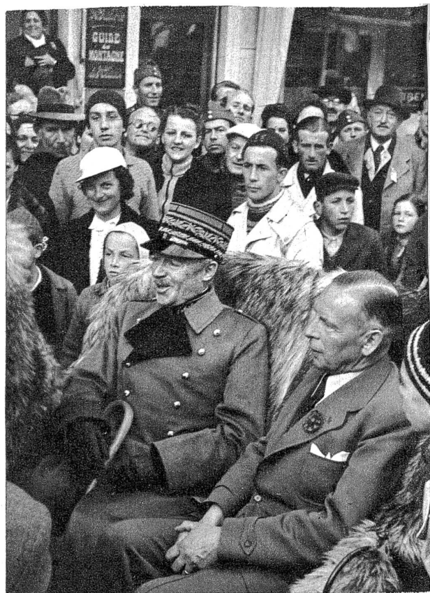
General Guisan, Ehrenpräsident des Schweiz. Skirennens, unter den Zuschauern.

Es ist ein besonders guter Gedanke, unsere Sportler und Sportbegeisterten auf eine solche Weise auf unser nationales Hilfswerk hinzuweisen und für die gute Sache vorzuspannen. Wenn irgendwo, dann darf gerade unter Sportlern restlose Bereitschaft und Solidarität für eine grosszügige Hilfeleistung an die vom Schicksal hart betroffenen Wehrmänner vorausgesetzt werden.