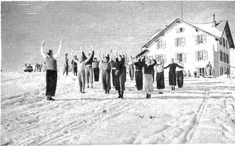
Turnstunde vor dem Hotel Männlichen