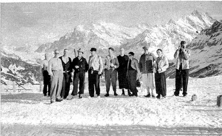
Die Kursteilnehmer auf dem Männlichen