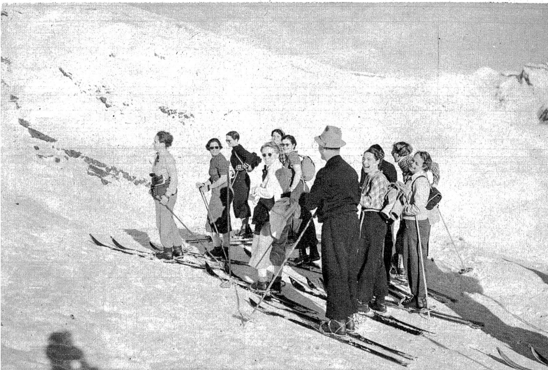
Aufstieg zum Männlichen. Start auf der Kleinen Scheidegg