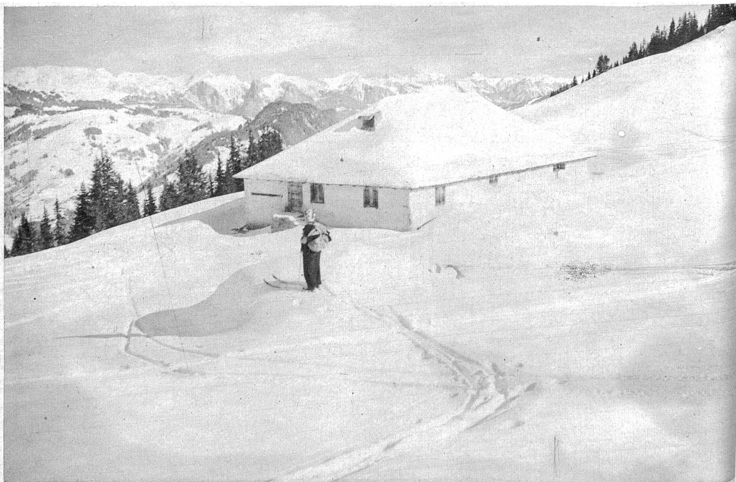
Obere Kübelialp, Blick nach Norden, Hundsrück und umliegende Berge.