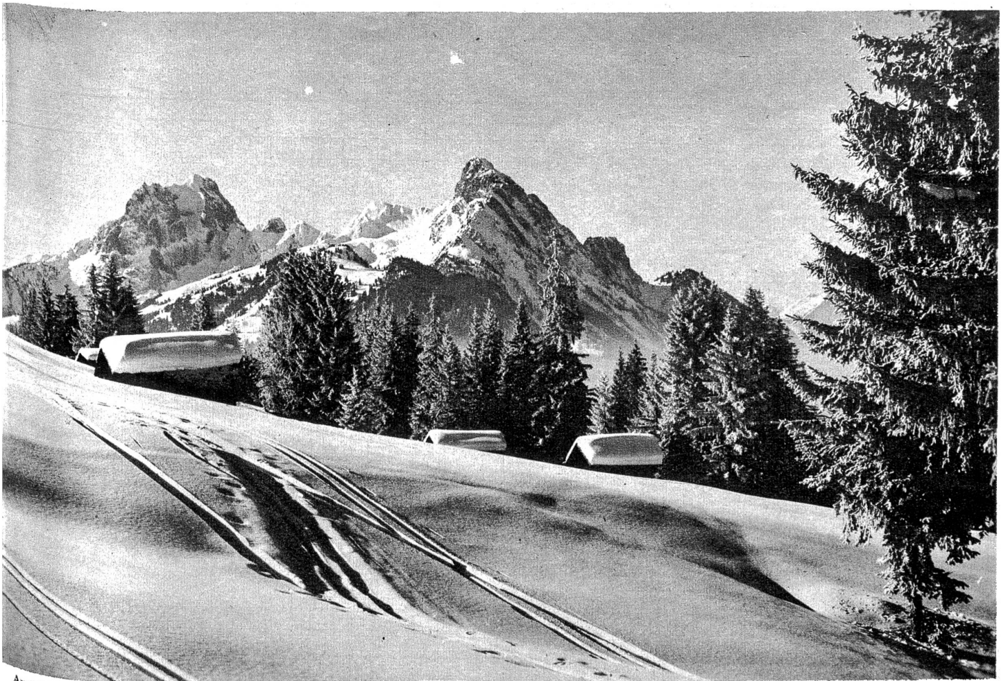
Aus dem Wintersportgebiet der Montreux-Berner Oberland-Bahn: Saanenmöser mit Rüeblihorn und Gummfluh. (Phot. Nägeli)