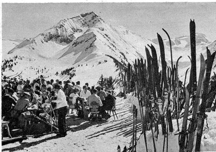
Hornberg mit Giffhorn im Hintergrund.