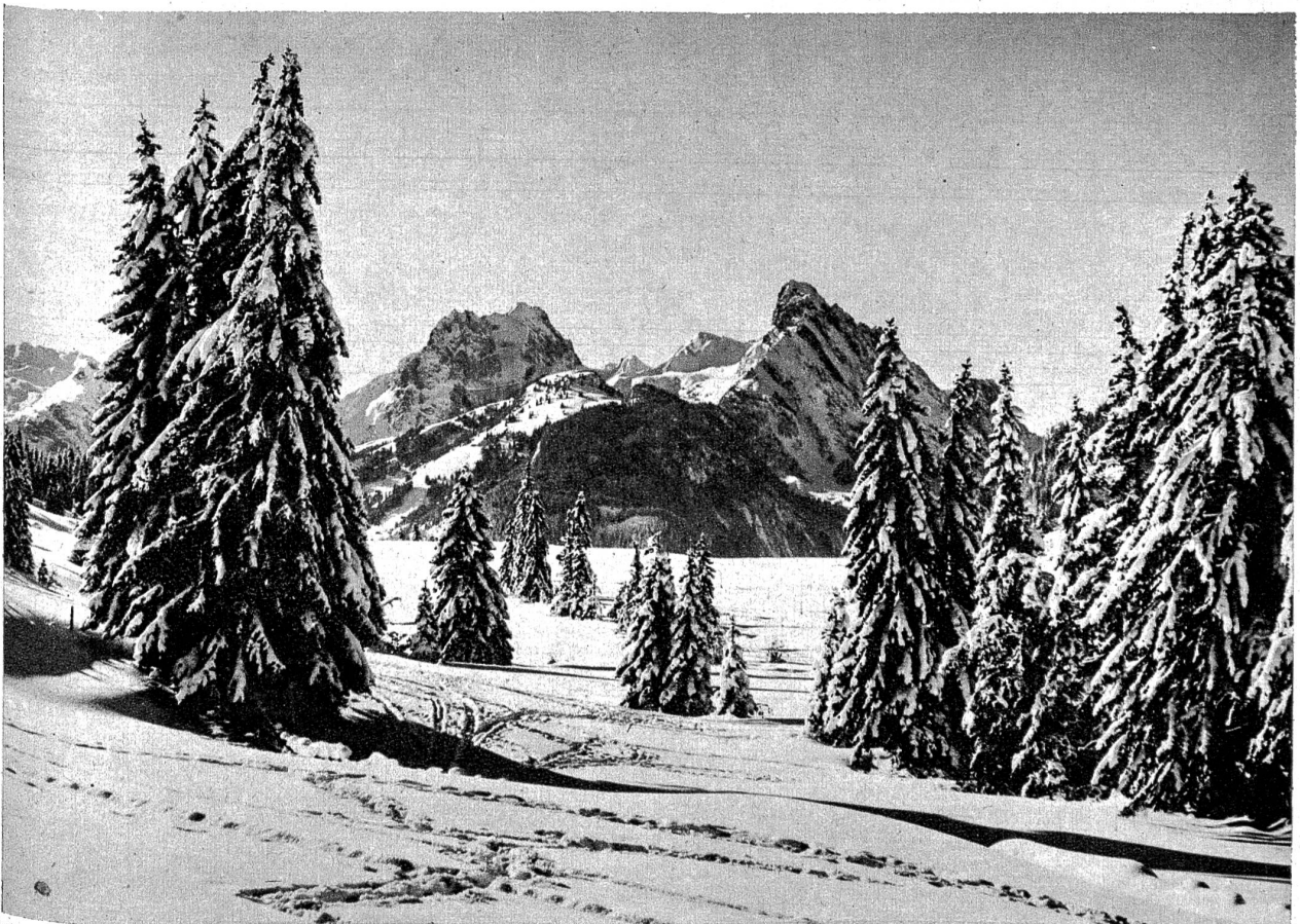
Bequem erreichbar und mitten in einem ausgedehnten Skigebiet, bilden die Saanenmöser den Ausgangspunkt zu den verschiedensten lohnenden Touren.