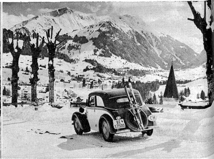
Einfahrt ins idyllische Gstaader-Gebiet. Giffhorn-Wassergrat