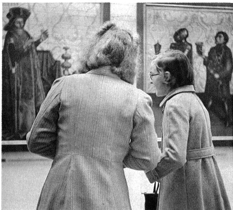
Zwei Mädchen vor Bildern von Konrad Witz aus der Basler Sammlung.