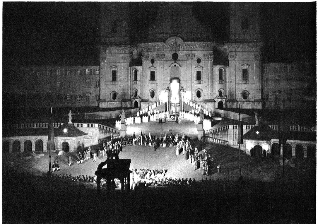
Wiedererweckung des mittelalterlichen mysterienspiels. — Die eindruckstiefen, geistlichen Festspiele zu Einsiedeln. Unser Bild zeigt eine Gesamtaufnahme mit allen Chören aus Calderons „Grossem Welttheater“ (Regie: Dr. Oskar Eberle, Thalwil).

„Wie in der Politik, so hat auch auf dem Gebiete des Theaters der Gemeinschaftsgedanke in der Schweiz seinen sinnfälligen Ausdruck und seine jahrhundertealte Tradition gefunden: die Schweiz besitzt als die älteste der zeitgenössischen europäischen Demokratien auch eine 400jährige lückenlose Tradition des Volks- und Gemeinschaftstheaters.“ (Vgl. dazu den Aufsatz von Dr. Oskar Beer auf Seite 963).