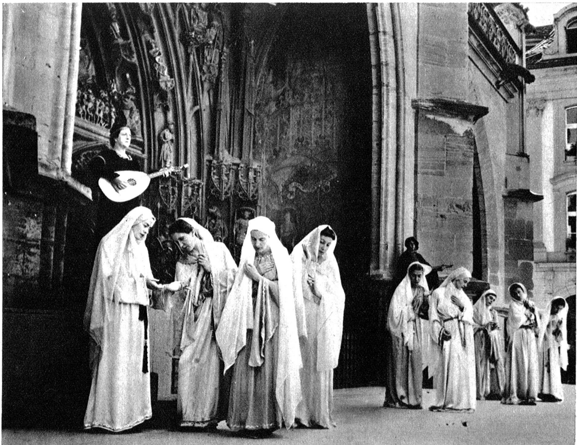
„Festliche Münsterspiele“ vor dem Münster portal in Bern. Bilder aus der Tanzkantate „Ewiger Reigen“.