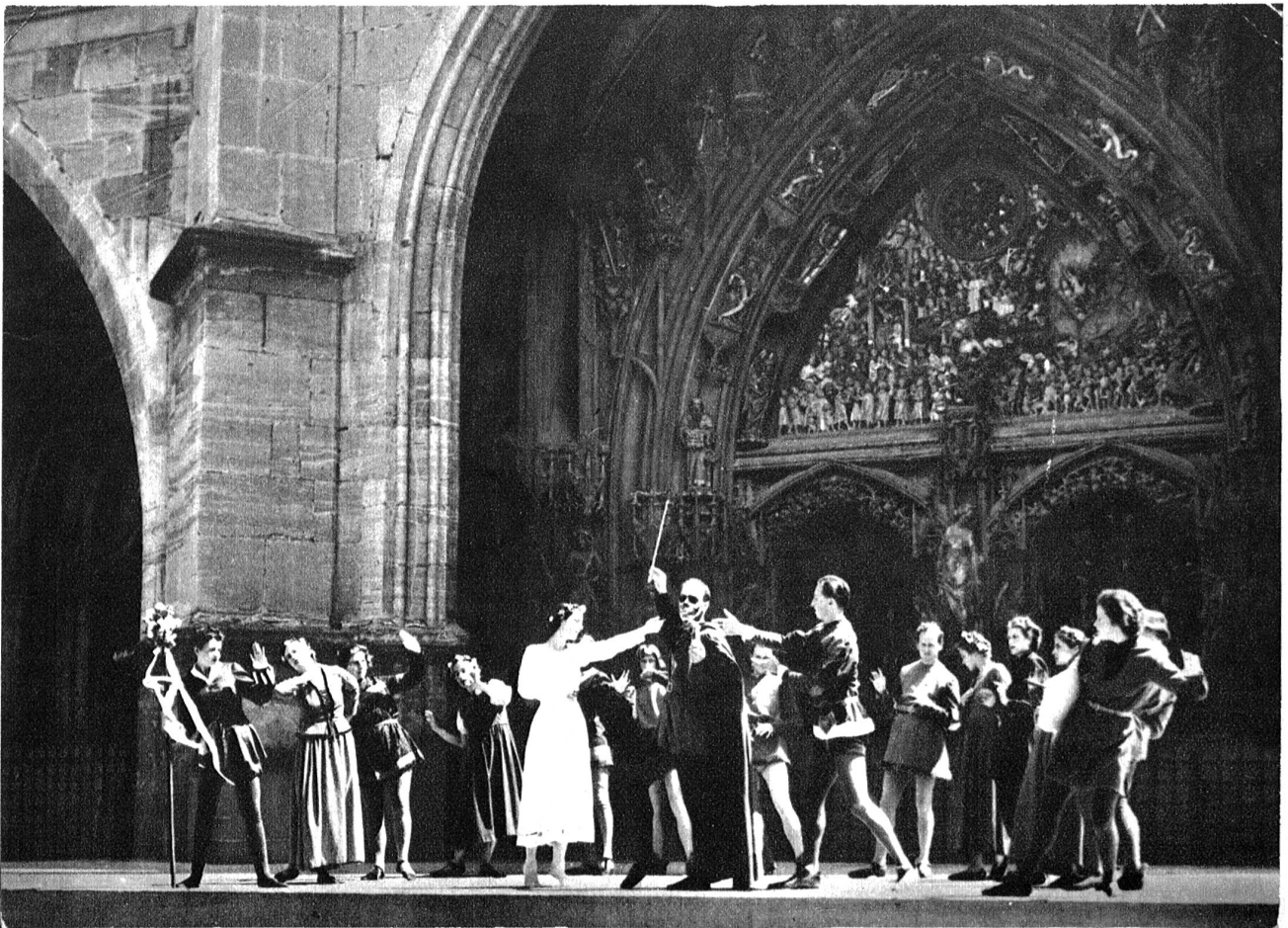
Das überaus stimmungsvoll und echt wirkende realistische Bühnenbild der „Berner Münsterspiele“, das in seiner mittelalterlichen Eigenart wohl kaum seinesgleichen findet: (Phot. Erismann)