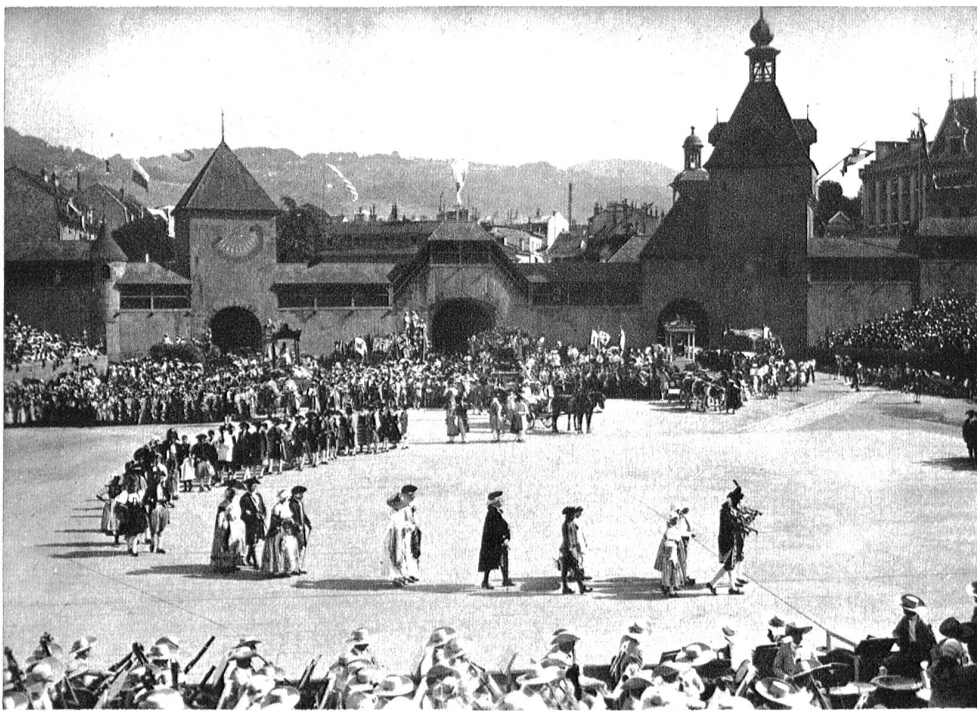
„Fête des vignerons“ in Vevey. Immer mehr entwickeln sich diese Spiele zu bedeutenden Gemeinschaftsspielen der Westschweiz, die auf echt eidgenössischer Volkstheater-Tradition aufbauen.