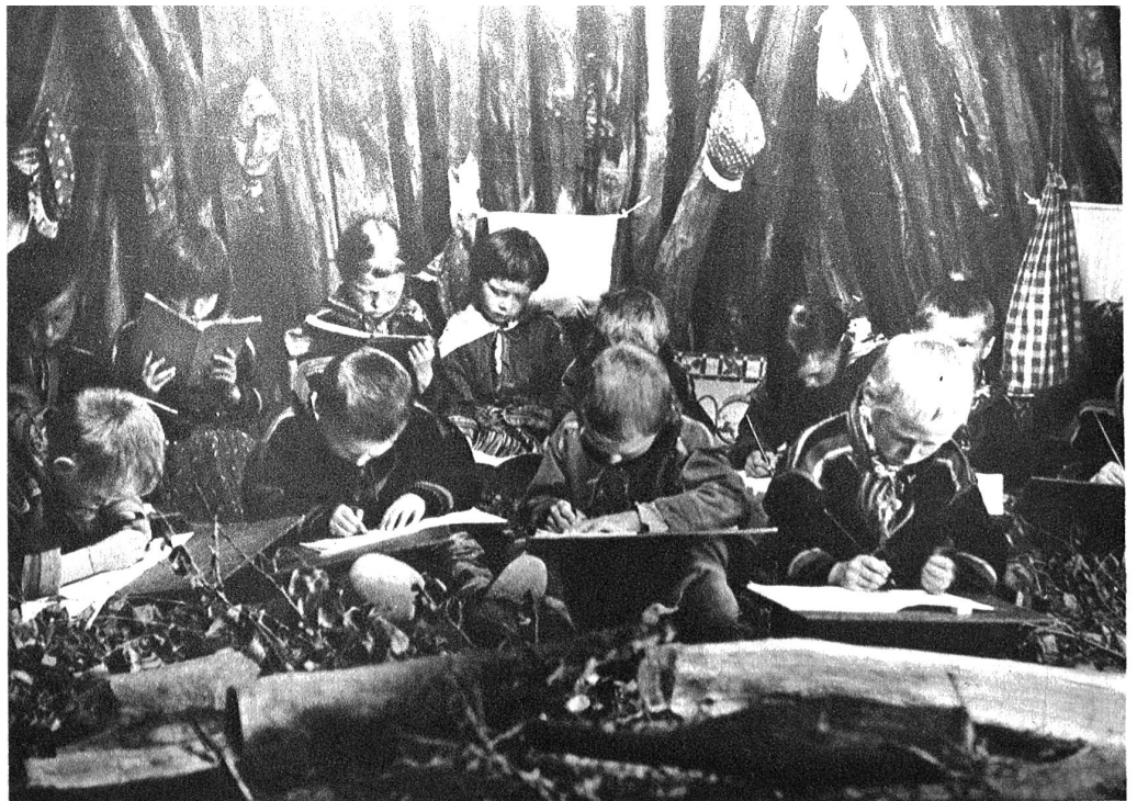
Die Sommerschule in der Lappenhütte, der sogenannten Kota. Lerneifrig über ihre Schreibbretter gebeugt, sitzen die Kinder um das offene Feuer auf dem Reisigboden.