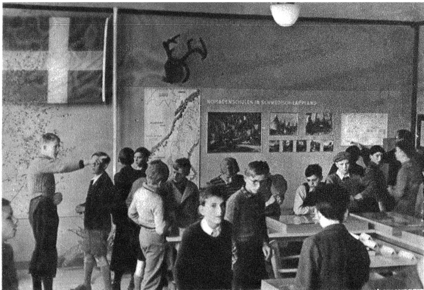
Blick in die Ausstellung. Links die Finnische Fahne.