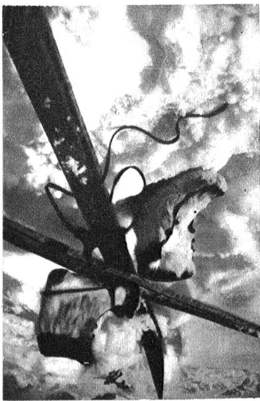
Der Lappenski mit den dazugehörigen Fell-Skischuhen.