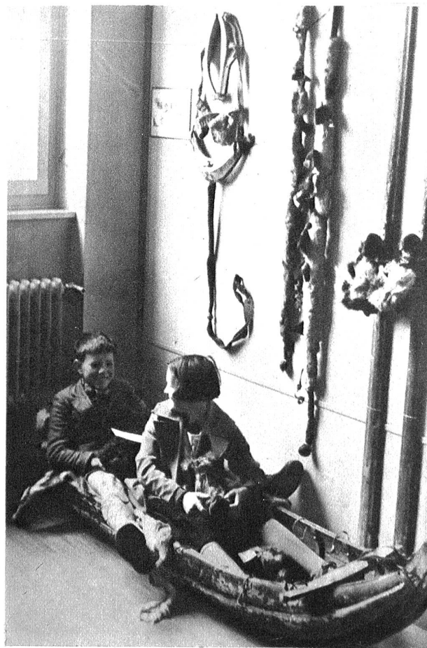
Zwei Berner Schulkinder sitzen im Lappenschlitten.