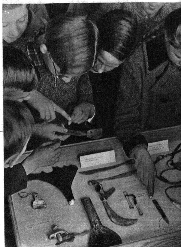
Und das Schönste — man darf alles berühren! Die Schulkinder besichtigen von Hand die Werkzeuge und Geräte der Lappen.