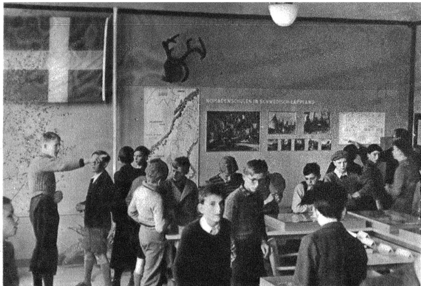
Blick in die Ausstellung. Links die Finnische Fahne.