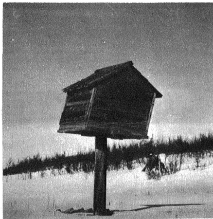
Gegen wilde Tiere sind die Vorratshäuser der Lappen auf einem hohen Pfahl gesichert.