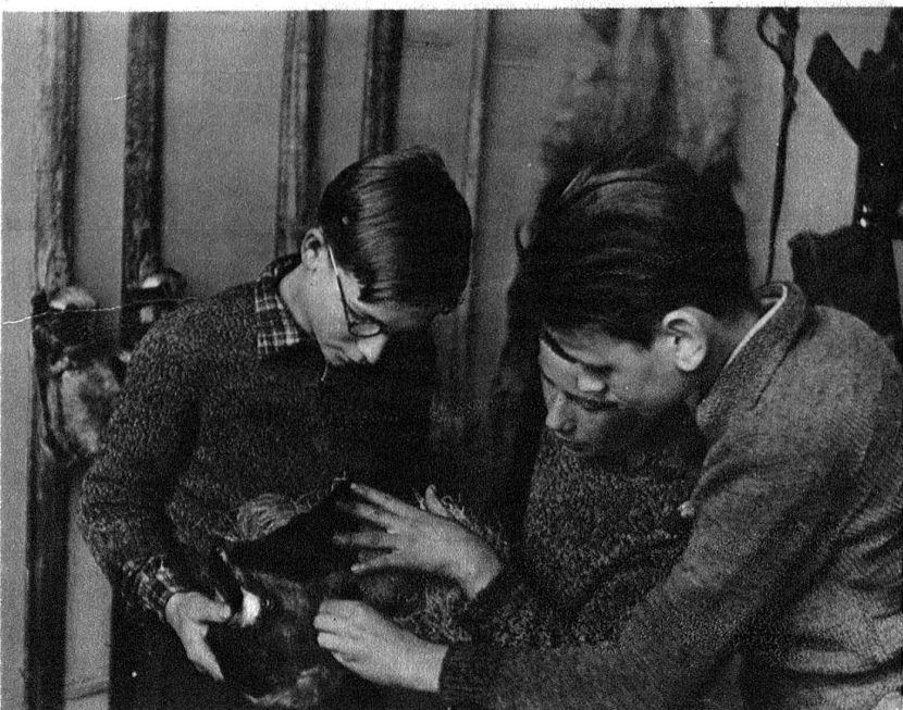
Der Fell-Skischuh. Statt Socken trockenes Gras.