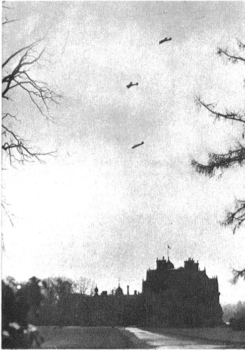
Luftangriff auf ein englisches Königsschloß. Scheinangriff von Bombenflugzeugen, Abwurf von Rauchbomben unter Einsatz von Luftabwehr, Polizei, Feuerwehr, Luftschutz und Krankenschwestern.