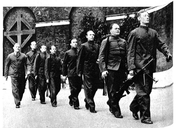
Auch die Bühne macht sich kriegsbereit. Englische Schauspieler beim Morgenexerzieren.