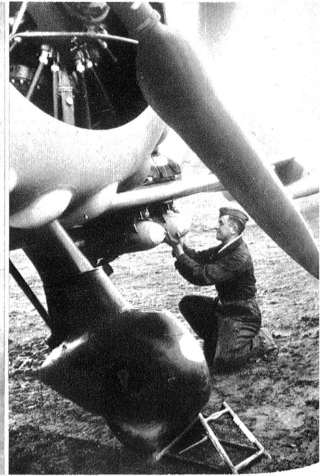
Letzte Prüfung der Bomben an einem Sturzkampfflugzeug.