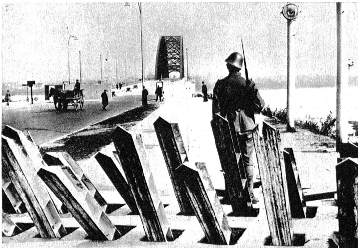
Tankfallen und Grenzsicherung an der holländischen Grenze.