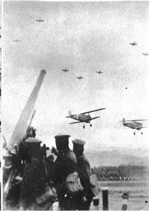
Japanische Flieger und japanische Artillerie an der südchinesischen Kampffront. (Atlantic Photo).