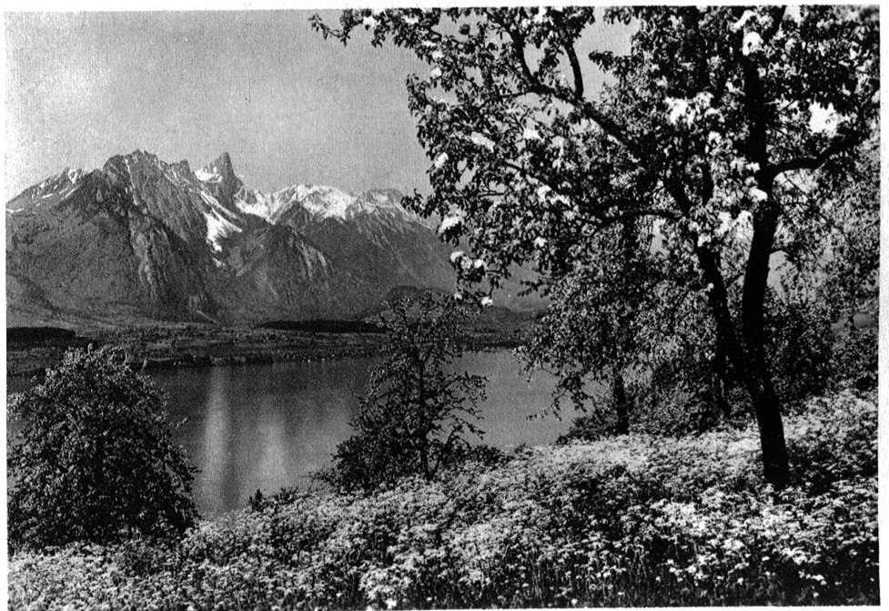
Bei Sigriswil, Stockhorn.