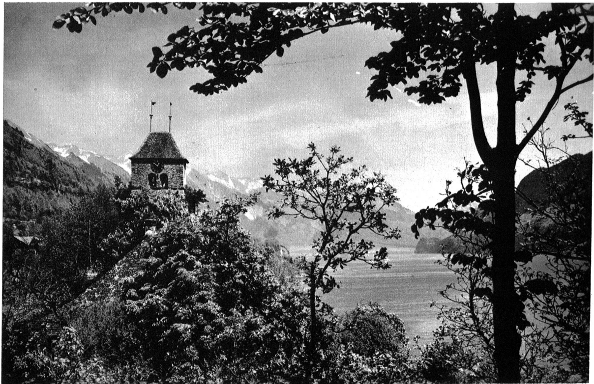
Ringgenberg am Brienzensee, Kirche.