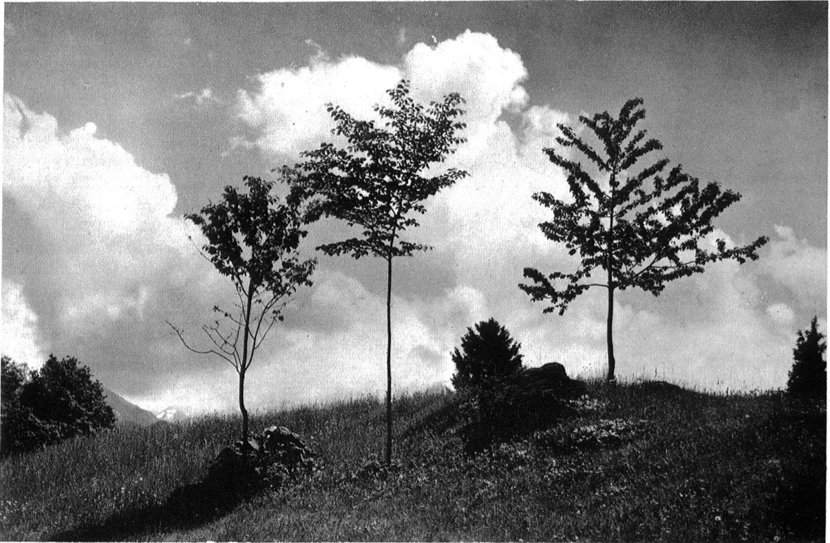
Frühling im Hondrich ob Spiez.