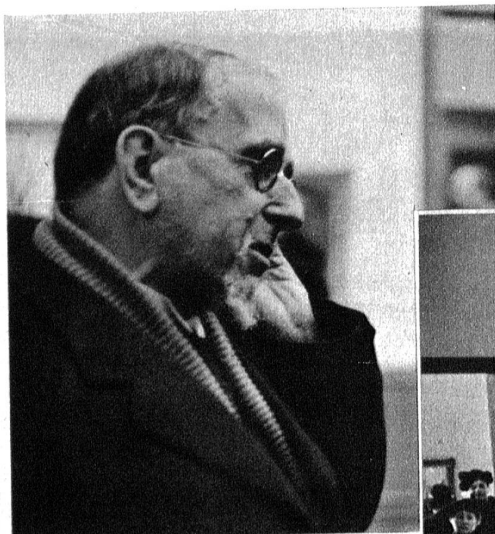
Altmeister Ernst Kreidolf.