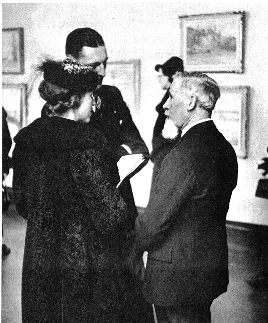
Adolf Tièche im Gespräch mit einem Kunstfreund.