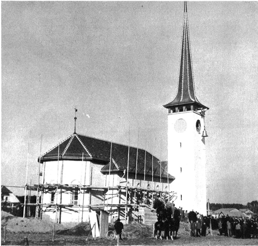
Der schmucke Neubau der Kirche von Zollikofen, der seiner baldigen Vollendung entgegengieht. Architekt: A. Wyttbach.