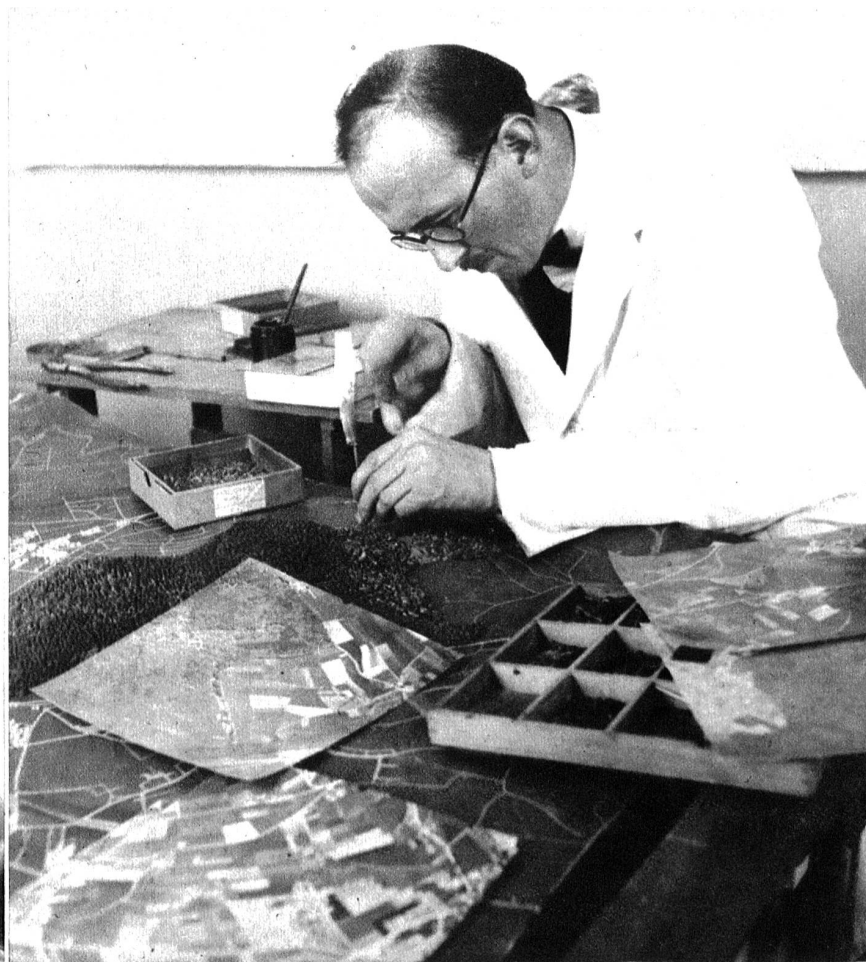
Zur Bewältigung dieser Arbeit brauchte es einen Zeitaufwand von rund 25,000 Arbeitsstunden. Tausende von einzelnen Bäumchen sind zur Darstellung von Laub und Nadelwäldern verwendet worden.