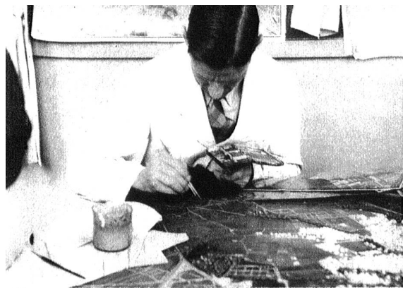
Ein „Landschafter“ besorgt die umfassende Terrainbemalung sowie die Bemalung jedes einzelnen Häuschens.