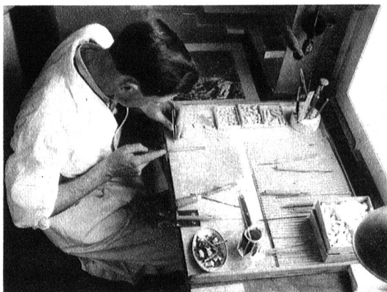
Rund 10,000 Häuschen sind bis heute mit Feile und Stichel in Spezialgips naturgetreu zugeschnitten worden.