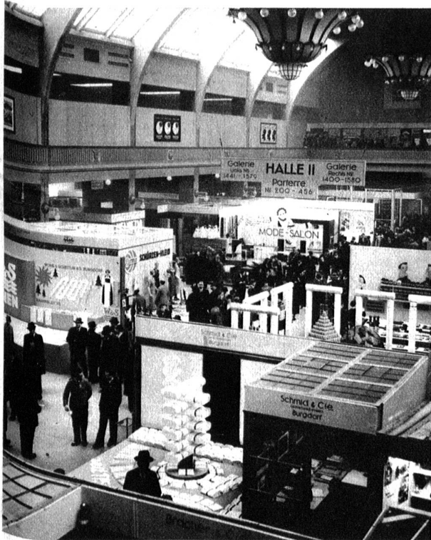
Blick in die Halle der Textilindustrie

Es steht die Mustermesse 1939 wiederum vollständig im Verkaufsdienst der Schweizer Technik. Wie die Schweiz ihre Ströme vom Gotthard aus nach allen vier Himmelsrichtungen ausendet, so bietet die Schweizer Mustermesse 1939 dem gesamten Weltmarkt nach Osten und Westen, nach Norden und Süden ihre Güterproduktion zur Aufnahme an. Sie bekennt sich damit als ein kleiner, aber auch in seiner Kleinheit ebenbürtiger Teilnehmer zu allen kulturellen und wirtschaftlichen Bestrebungen, die in der ganzen Welt auf die Erhaltung und Stärkung der Weltwirtschaft als Ganzes ausgerichtet sind.