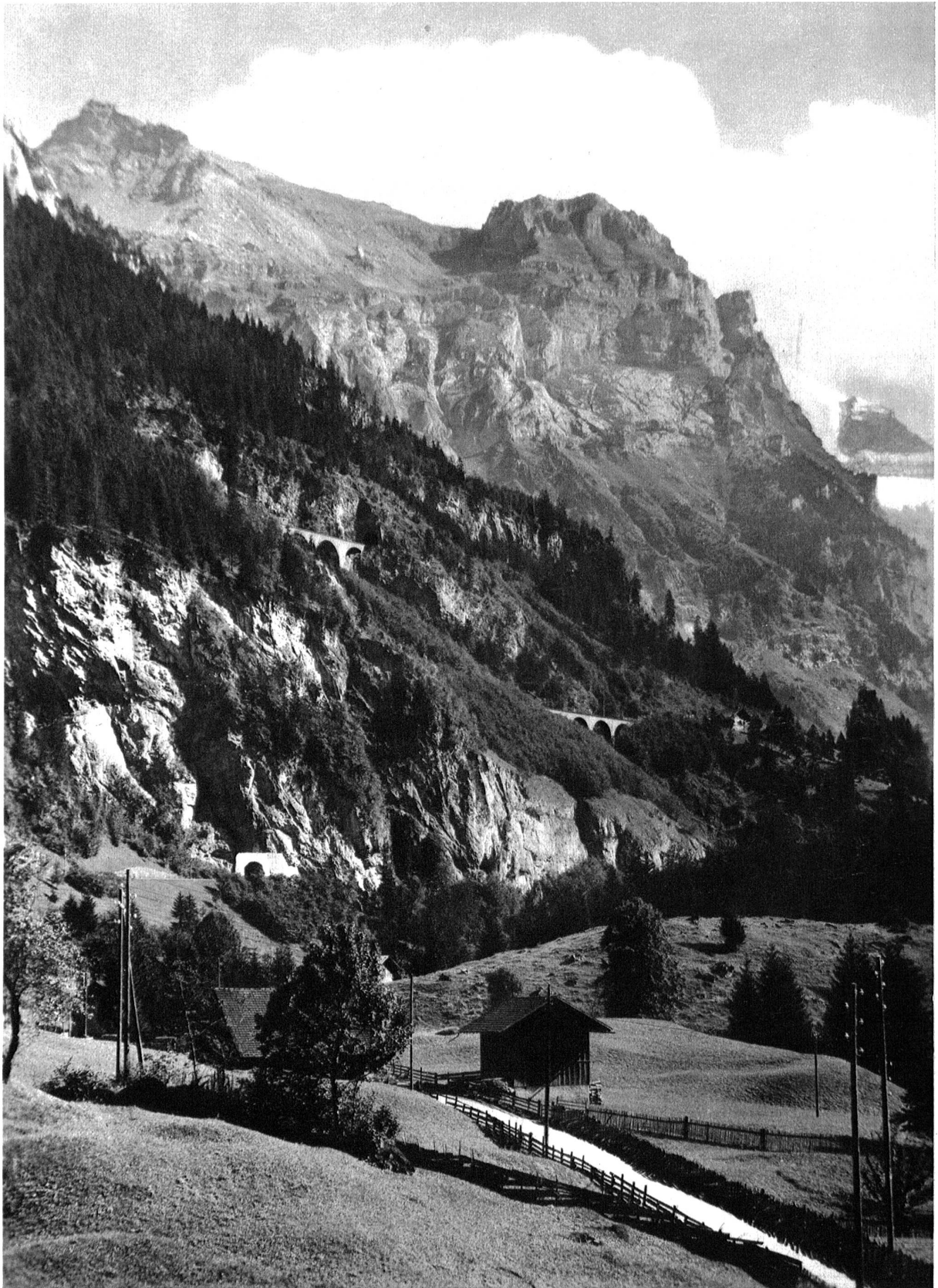
Die grandiose Wirklichkeit des Kandertales — das „Modell“ der Miniaturanlage, die auf dem Gelände der Landesausstellung im Entstehen begriffen ist.