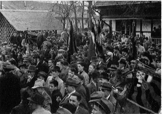
Gespannte Gesichter während der Rangverkündung.