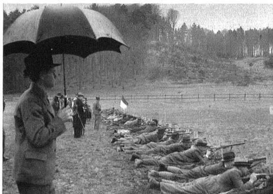
Die Schützenlinie. Geschossen wurde auf ein Feldziel, 12 Schüsse in 3 Minuten.