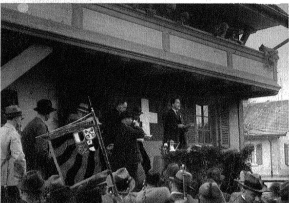
Der Verbandsschützenmeister verkündet die Ränge.