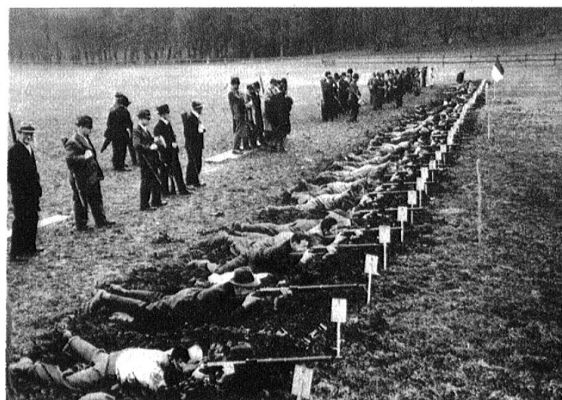
Die Schützenlinie im Feuer. Die Ablösung steht bereit.