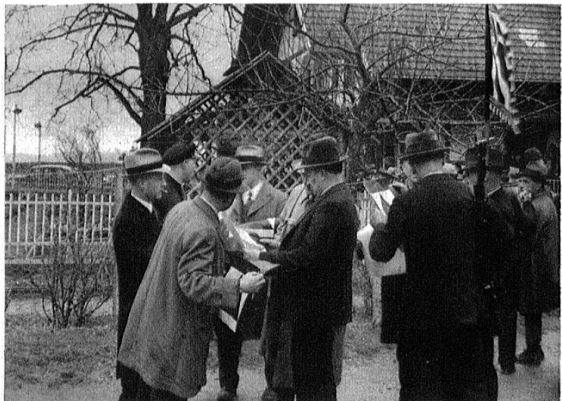
Die Scheiben sind offenbar nicht ganz nach Wunsch der Schützen.