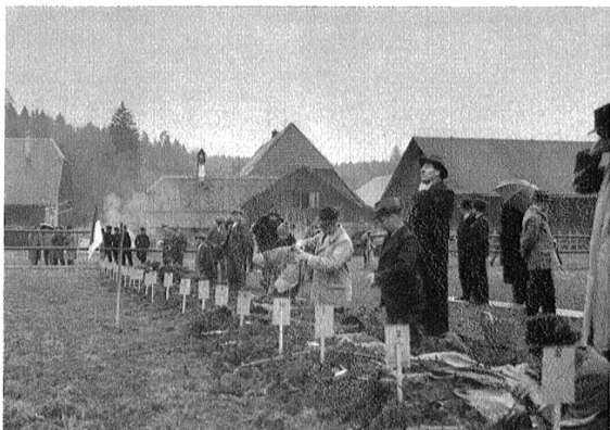
Bereitmachen vor dem Feuer.