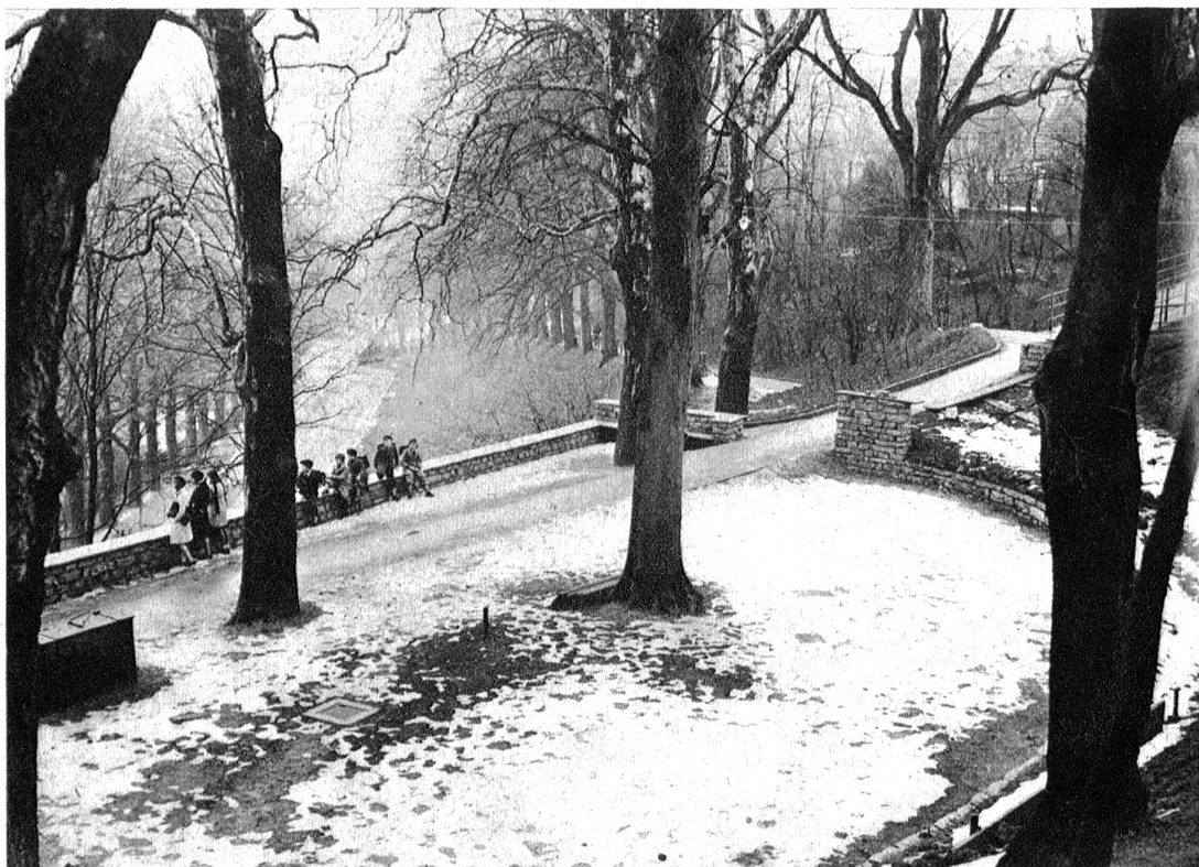
Zu Ehren des grossen Berner Dichters Rudolf von Tavel wird gegenwärtig ein Denkmal in der Form einer grossen Terrasse an der Liebegg erstellt. Von ihr schweift der Blick über die von der Aare umschlungene Altstadt mit dem beherrschenden Münster. Als Schmuck wird die Erstellung eines alten Brunnens aus einem bernischen Herrschaftssitz in Erwägung gezogen. Anstelle der sonst üblichen Denkmäler entsteht so eine sinnvolle Erinnerungsstätte an den grossen Berner Patrioten.