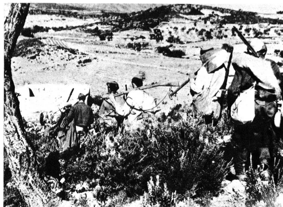
Ein nationalistisches Infanterie-Detachement auf seinem Vormarsch in Katalonien.