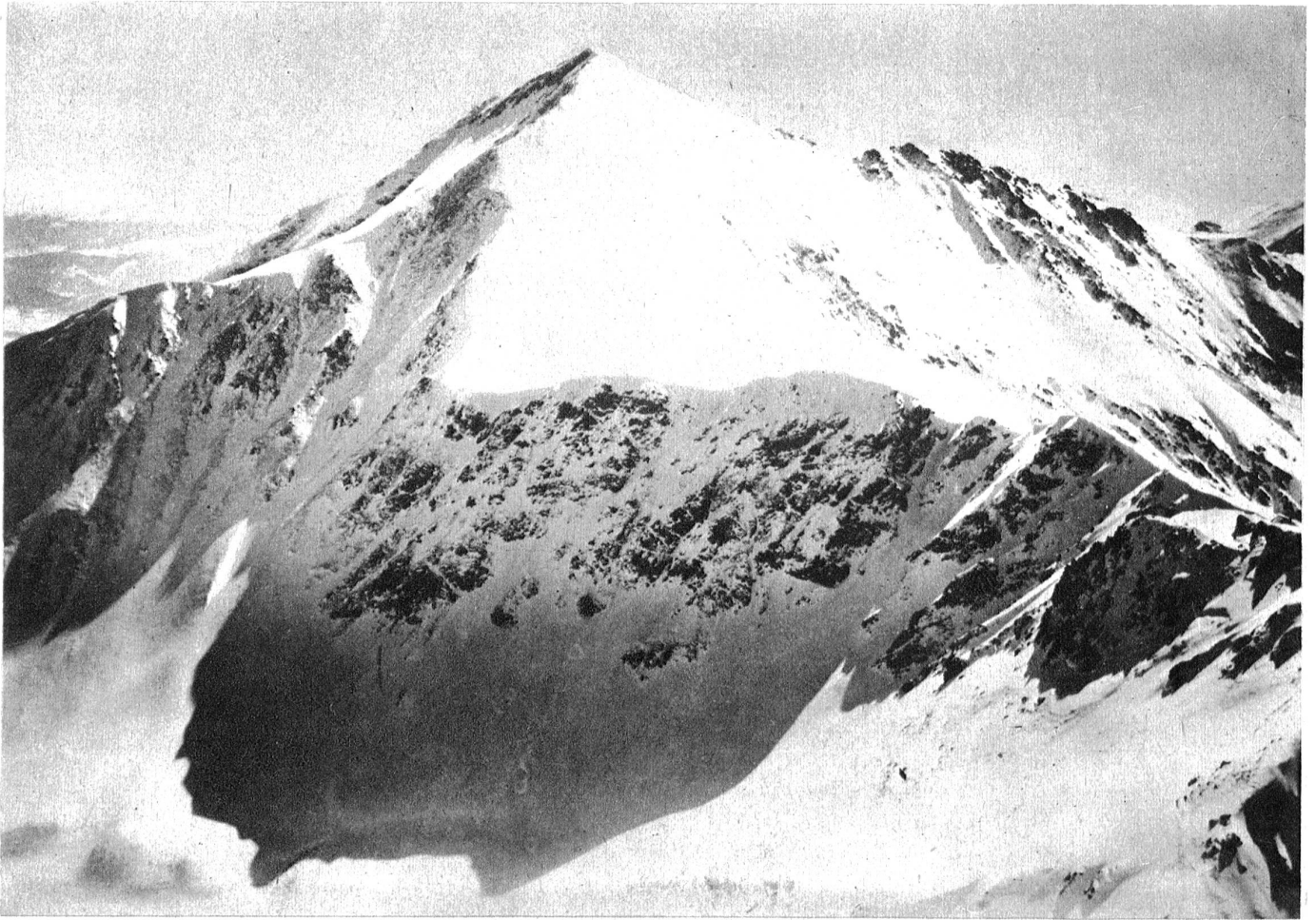
Hier finden die Skiweltmeisterschaften statt. Ein Blick in die Tatra in der Nähe von Zakopane in Polen, wo vom 11. bis 19. Februar die Ski-Weltmeisterschaften der FIS stattfinden.