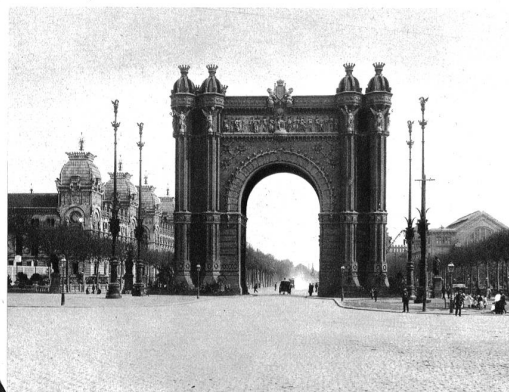
Barcelona ist als Hauptstadt des nationalistischen Spaniens ausgerufen worden. Wir zeigen aus Bar- celona den Triumphbogen, der den Abschluss der breiten Strasse Salon de San Juan bildet.