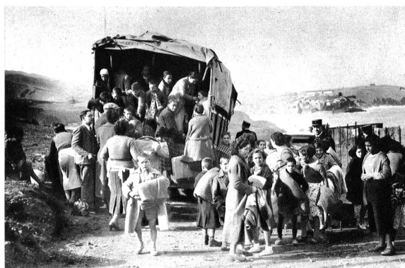
Eine Gruppe spanischer Flüchtlinge an der fran- zösischen Grenze. Wir machen unsere Leser in diesem Zusammenhang auf die klassische Flüchtlings-Dichtung, auf Goethes „Hermann und Dorothea“ aufmerk- sam.