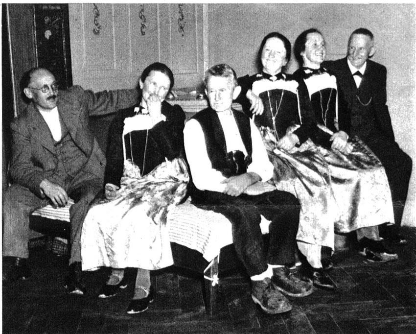
Am Abend sassen der Grossvater und seine Kinder am warmen Ofen in der Stube beisammen.