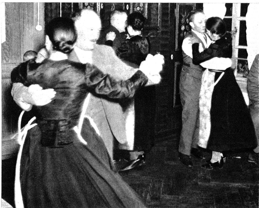
Abends drehte man sich beim Tanze fröhlich im Kreise.