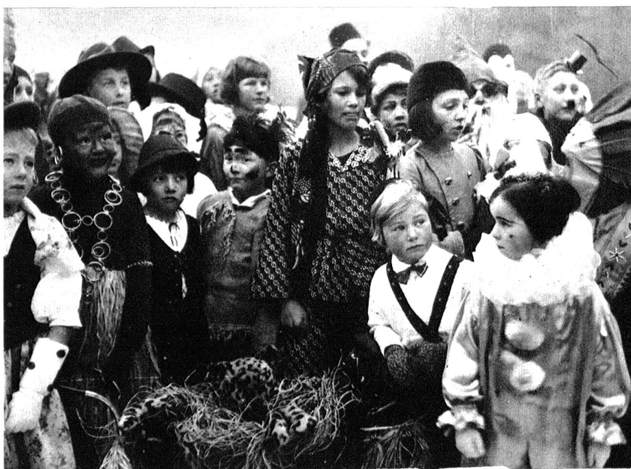
Für die Jugend wurde das Kostümfest zum alljährlichen Höhepunkt von Sport und Fröhlichkeit