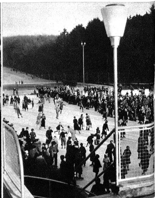
Blick auf das Eisfeld von der Terrasse aus