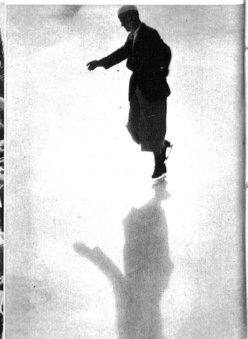
Bis in die Nacht hinein gibt's da für den Trainer und Lehrer nicht viele Mußestunden.