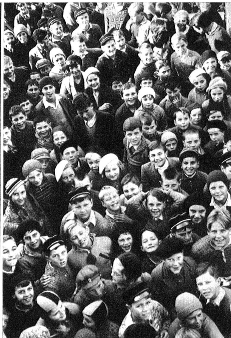
Voll sportlicher Begeisterung folgen schon „Jüngsten der Jungen“ den Ka We De-Veranstaltungen.