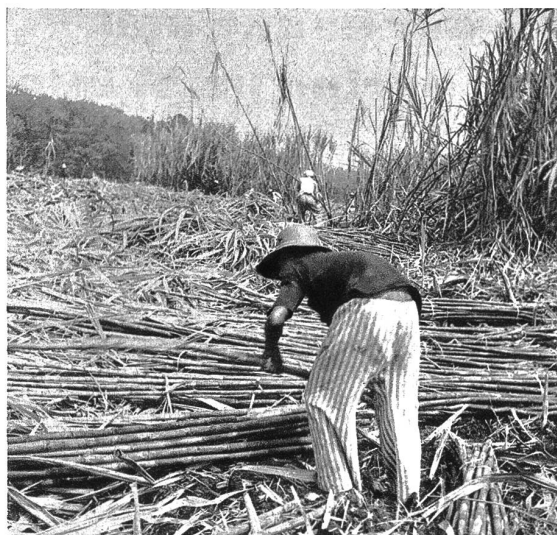
Zuckerrohrernte auf Java. Neben Tee, Gummi und Tabak ist das Zuckerrohr eines der wichtigsten Kolonialprodukte Javas.