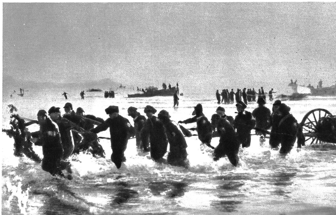
Die Landung der Japaner in Tsingtao. Japanische Truppen bringen bei Tsingtao Geschütze und Munitionsboote durch die Brandung ans Land.