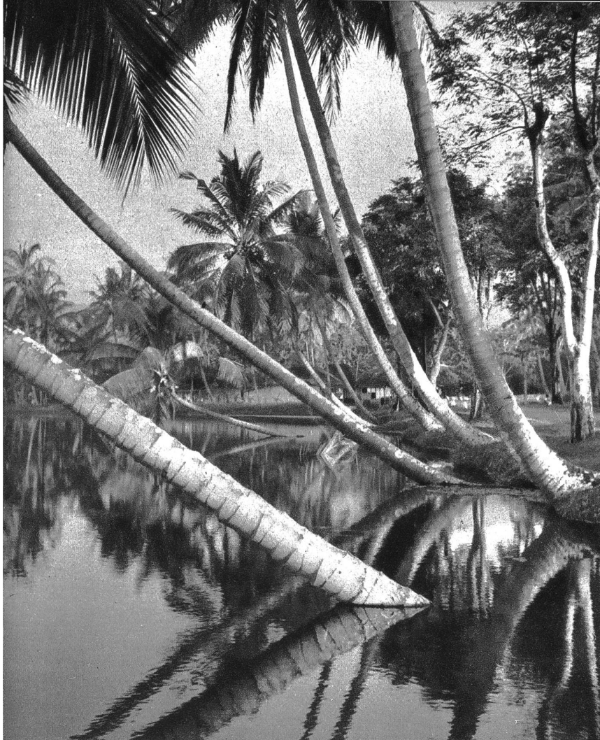
Tropenparadies: Kokosnusspalmen auf Java. Die Palmen sind die Wahrzeichen der Tropen.