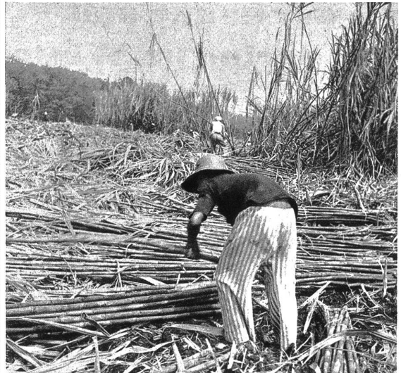
Zuckerrohrernte auf Java. Neben Tee, Gummi und Tabak ist das Zuckerrohr eines der wichtigsten Kolonialprodukte Javas.