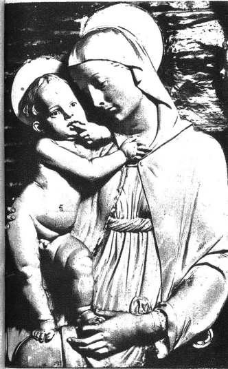
Andrea della Robbia. Madonna mit Kind.