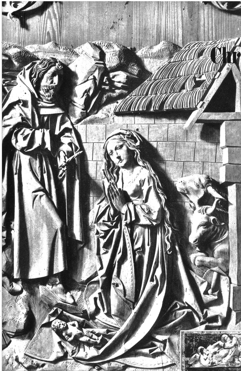
Aus dem Marienaltar von Tilman Riemenschneider, Herrgottskirche Creglingen a. T.

Zu allen Zeiten haben große Künstler christliche Feste und Begebenheiten in ihren Werken festgehalten. Von all den großen christlichen Ereignissen hat aber wohl kaum eines durch alle Zeiten hindurch so viel Anregung zum Schaffen gegeben, wie die Geburt Jesu. Ein kleiner Querschnitt durch solches Schaffen vermitteln wir heute unsern Lesern, ihnen allen damit auch frohe Weihnachtstage wünschend.