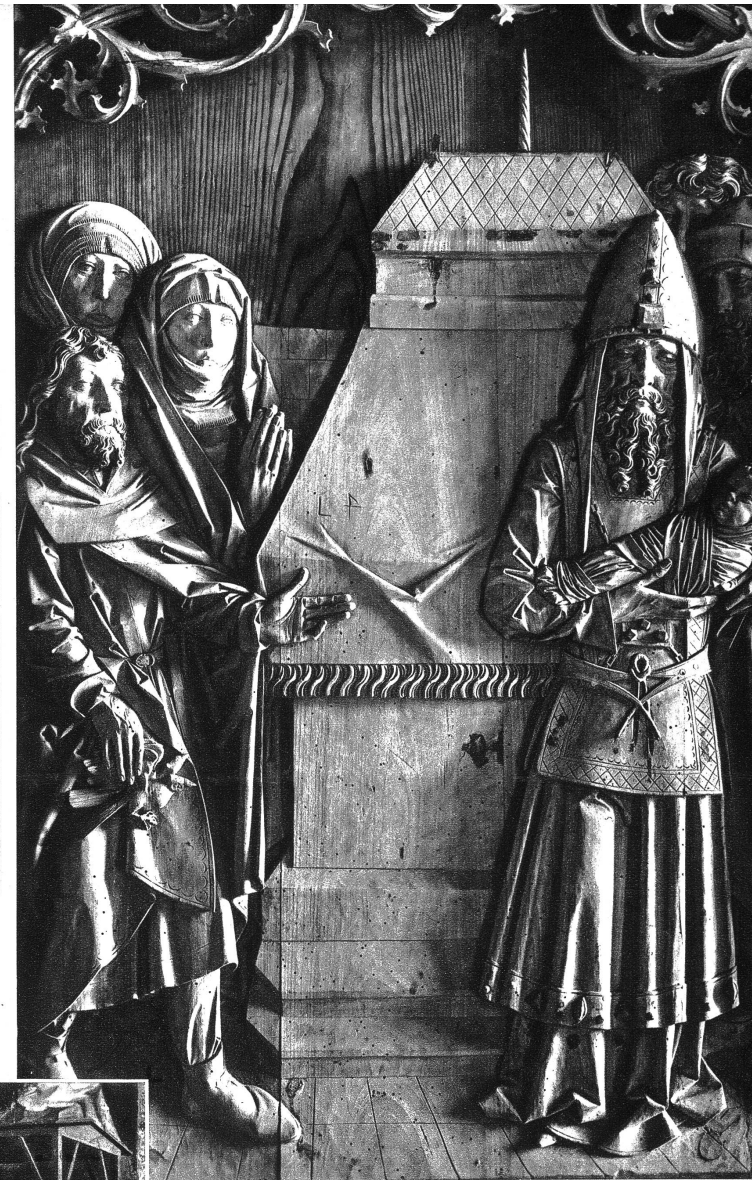
Aus dem Marienaltar von Tilman Riemenschneider, Herrgottskirche Creglingen a. T.