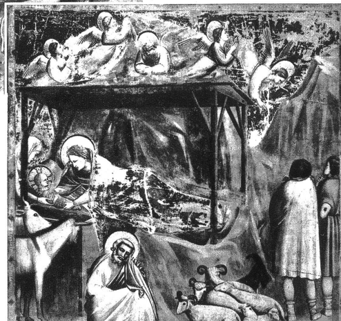
Giotto. Die Geburt Christi. Padua, Capella degli Scrovegni.