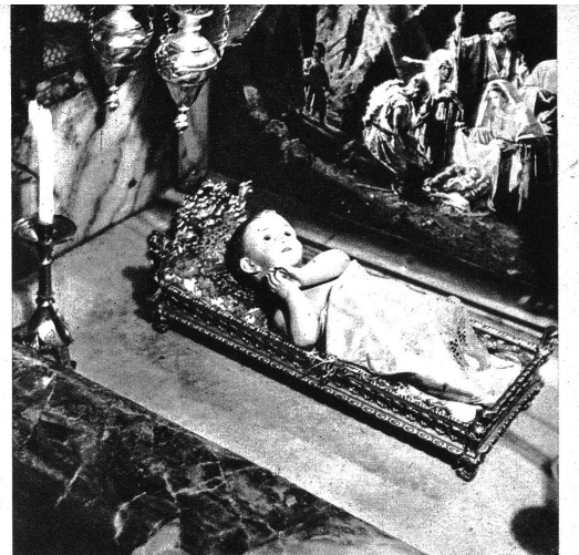
Eine Darstellung des Christkindleins in der Krypta der Heiligen Kirche.

Vor vierzehn Tagen fand in der Geburtskirche in Bethlehem die feierliche Weihnachts-Messe statt, die vom Erzbischof Jerusalems zelebriert wurde und zu der das ganze diplomatische Corps erschienen war. Es ist dies das erstemal, daß einem Photographen die Erlaubnis gegeben wurde, diese feierliche Zeremonie im Bilde festzuhalten. Unverändert blieb aus der Frühzeit der christlichen Bautunst die Geburtskirche in Bethlehem, welche ihre alte Form bis in unsere Tage bewahrt hat. Es ist eine große, fünfschiffige Basilika mit kleeblattförmigem Chor. Sie war das Vorbild für so viele andere Kirchen im heiligen Land, die im Sturm späterer Zeiten wieder verschwanden. Diese Weihnachts-Messe in der Kapelle von Bethlehem zählt mit zu den größten Festen, die es gibt und mag uns in diesen Adventstagen vor allem interessieren. W. Sch.