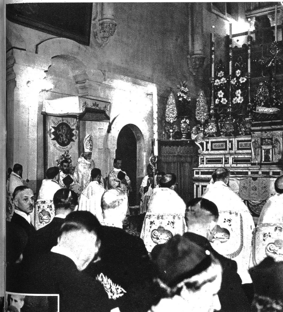
Erzbischof, die Mitternachtsmesse zelebrierend.