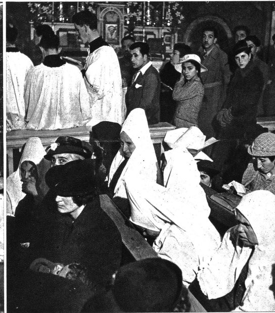
Bauern der Umgebung an der Mitternachtsmesse.