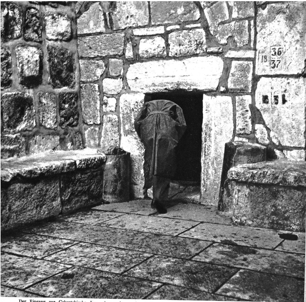
Der Eingang zur Geburtskirche Jesu, sie wurde an der Stelle erbaut, wo Christus geboren wurde.