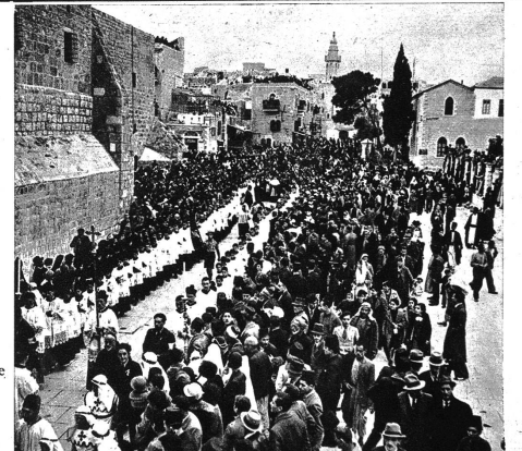
Die Prozession begibt sich zur Kapelle der Heiligen Helena.