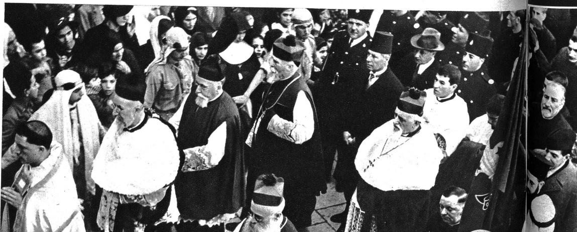
Hohe Geistlichkeit am Umzug zur Geburtskirche Jesu.