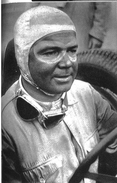
Der Sieger nach dem Rennen. Rud. Carraciola , zum drittenmal Sieger im Grand Prix