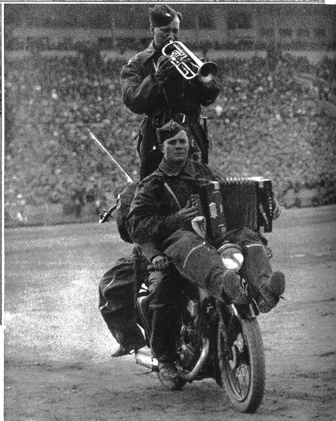
Eine ganze Musikkapelle auf einem Motorrad! Tschechoslowakische Soldaten führen zu viert auf einem Motorrad ihre Künste vor