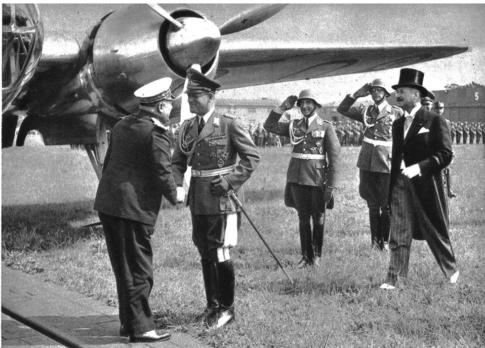
Der Generalstabschef der französischen Luftwaffe, General Vuillemin, in Berlin. Staatssekretär, General der Flieger, Milch (rechts) begrüßt den französischen General.