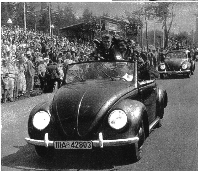
Ehrung im Volkswagen für die Sieger im Grossen Preis von Europa für Motorräder. Die Sieger der verschiedenen Klassen im Grossen Preis für Motorräder in Hohenstein-Ernstthal am 7. August 1938 wurden zur Ehrenrunde von Korpsführer Hühnlein in einem Modell des Volkswagen gefahren. Hinter dem von Korpsführer Hühnlein gesteuerten Wagen, in welchem Kluge, der Sieger in 250 ccm Klasse war, folgt der zweite Volkswagen mit den andern Siegern, unter welchen sich der Engländer White, der Sieger in der 350 ccm Klasse, befindet.