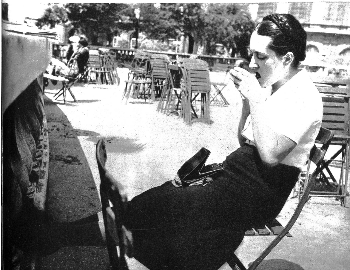
im „Jardin de Louxebourg“ in Paris