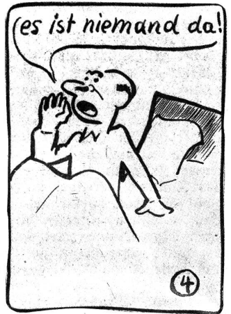
Bumps wird gestört.