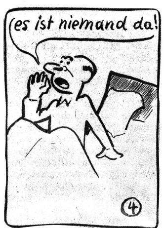
Bumps wird gestört.