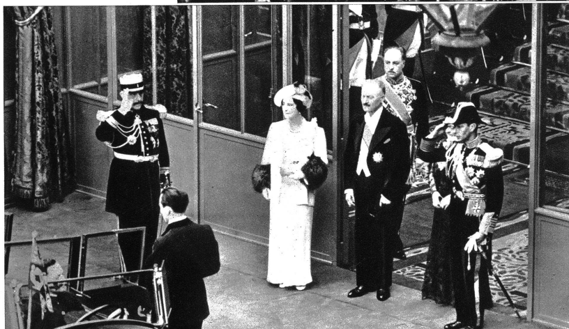
Das englische Königs-paar beim Verlassen des Elysée nach einem Staatsbesuch beim Präsidenten Lebrun. Links Königin Elisabeth, daneben Lebrun, hinter König Georg VI. die Gattin d. französischen Präsidenten