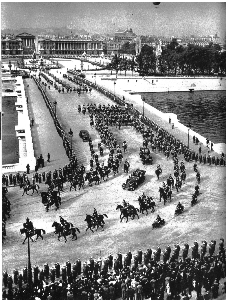
Die königlichen Wagen auf der Fahrt nach dem Quai d'Orsay. Oben das Verkehrsregelungsluftschiff, das von Polizisten besetzt, auf radiotelegraphischem Wege den Verkehr während den Ausfahrten des Herrscherpaares regelte.