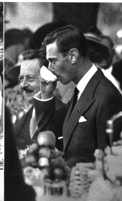
Auf der Gardenparty in Bagatelle. Am Nachmittag des zweiten Tages des Staatsbesuchs fand in Bagatelle eine „Gardenparty“ statt