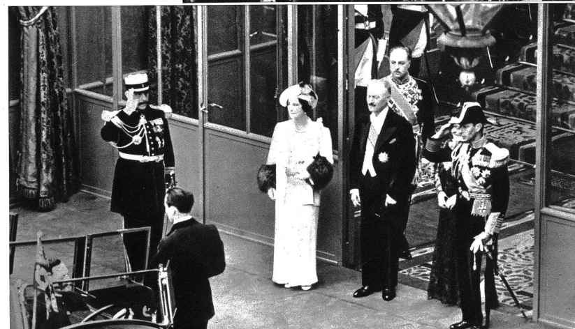
Das englische Königs-paar beim Verlassen des Elysée nach einem Staatsbesuch beim Präsidenten Lebrun. Links Königin Elisabeth, daneben Lebrun, hinter König Georg VI. die Gattin d. französischen Präsidenten