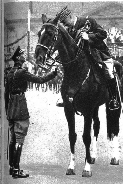
Der König begrüsst General Billotte, den Militärgouverneur von Paris, anlässlich der gewaltigen Truppenschau — der grössten seit der Beendigung des Weltkrieges in Frankreich — in Versailles