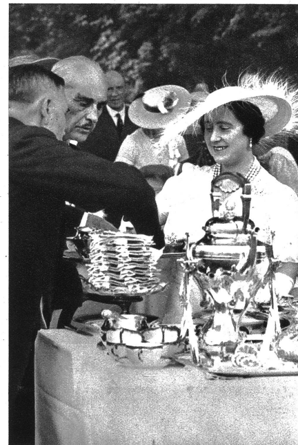
Auf der Gardenparty in Bagatelle. Am Nachmittag des zweiten Tages des Staatsbesuchs fand in Bagatelle eine „Gardenparty“ statt