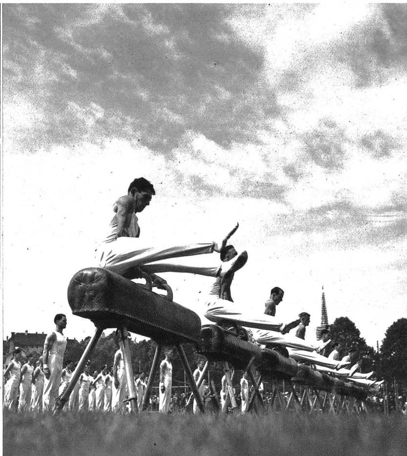
Knie zurück, Zehen hinunter! Die Sektion Madretsch am Pferd-Pauschen

Der Schweizer will seine Feste, er will Städte und Dörfer mit Fahnen beschmücken, er will Gesang, Musik, Tanz, frohe Herzen und Gesichter, hübsche Kranzjungfern und etwas für den Durst. So fanden letzten Sonntag im Lande herum viele Duzende von Festen statt, eines davon war das Bernische Kantonaltturnfest in Burgdorf. Dort maßen sich die Jungen vieler großen und kleinen Sektionen, die Kunstturner, Leichtathleten und Schwinger kämpften um das grüne Laub, viele Tausend Menschen aus Stadt und Land bestaunten die flotten Arbeiten unserer bernischen Turnerschaft. B. S.