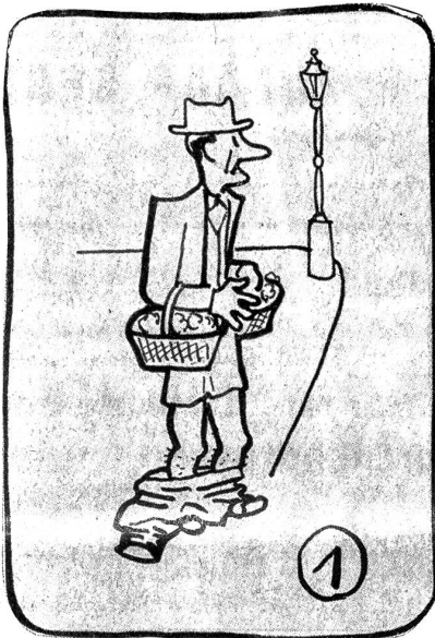
Bumps weiß sich zu helfen.

Geburten in Spitälern, von Kindern, deren Eltern in Bern wohnen, kamen in den Jahren 1921—1924 etwas über ein Viertel vor; im Jahr 1925 ein Drittel; seit 1933 waren es stets über die Hälfte.