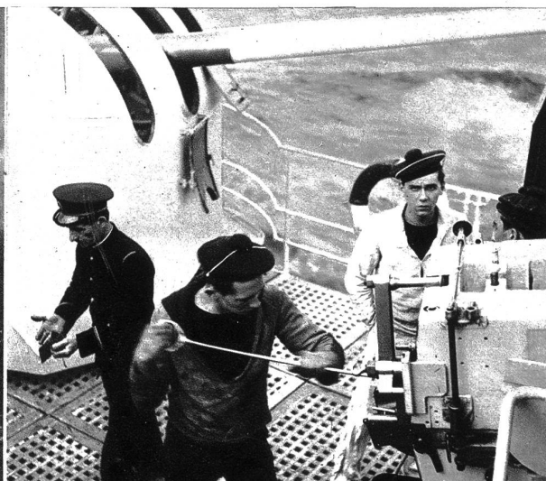
Links: Eine Salve dröhnt über den See . . .