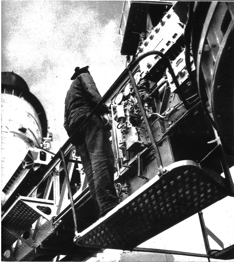
Dieses Bild gibt eine Ahnung von der ganz über alle Vorstellung komplizierten Mechanik eines modernen Kriegsschiffes