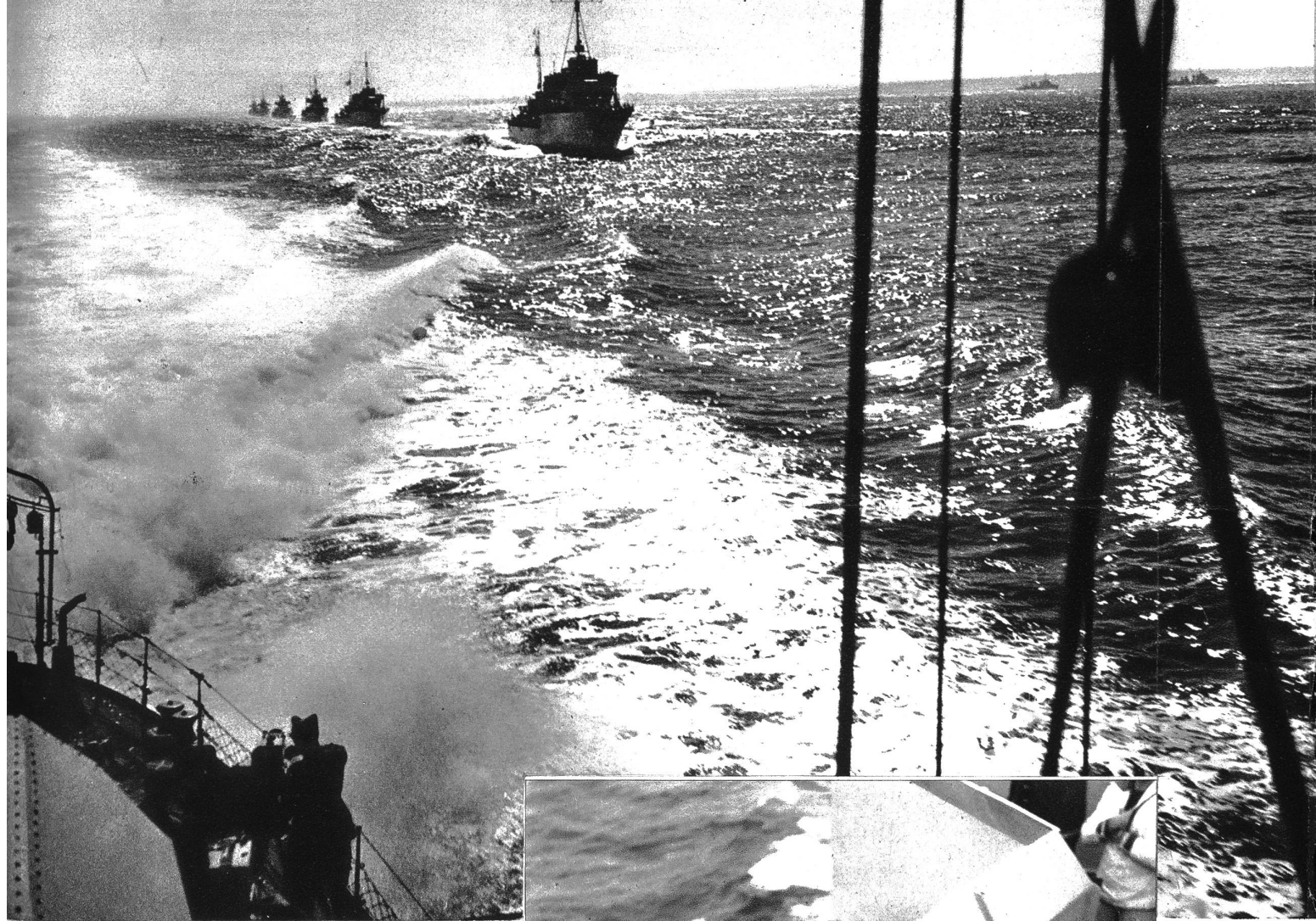
Die Zerstörer-Flotille in Kiellinie