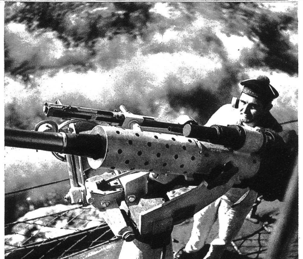
Am Fliegerabwehrgeschütz wartet dem Matrosen eine schwere Aufgabe

Einem unserer Mitarbeiter wurde die Erlaubnis gegeben, während der französischen Hochseemanöver auf dem Flaggschiff zu photographieren. Was er nach Hause brachte, geben wir hiermit unsern Lesern wieder, ihnen damit eine neue Welt erschließend. Leider eine Welt von Vernichtung und Tod. Was könnten mit den Milliarden, die von allen Staaten in die Hochseeflotten investiert werden, für Kulturwerte geschaffen werden! Erleben wir wohl noch einmal die Zeiten, wo die Völker zueinander wieder Glauben und Vertrauen fassen? Oder besteht der „Weltfriede“ in den ungeheuren Aufrüstungen?