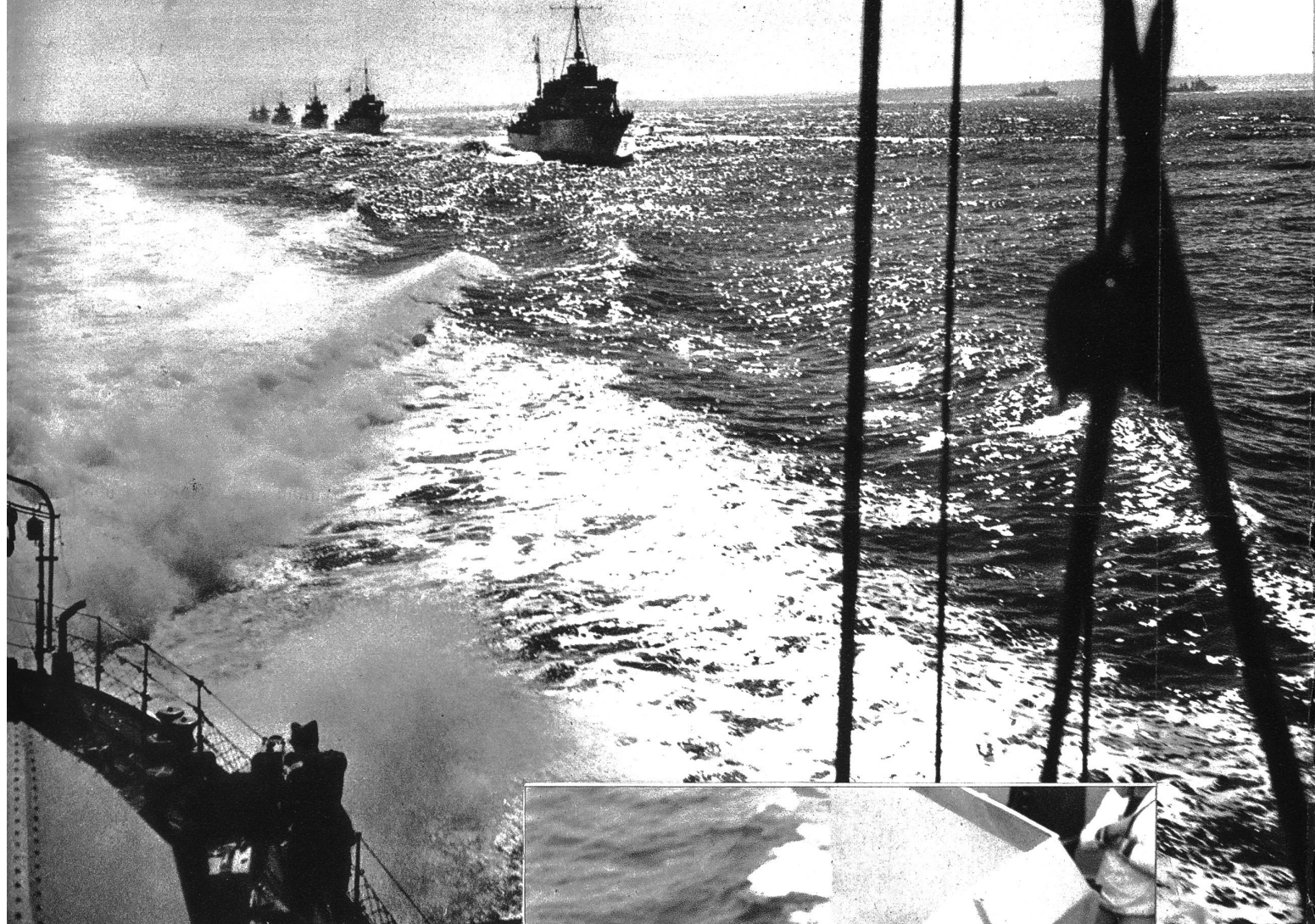
Die Zerstörer-Flotille in Kiellinie