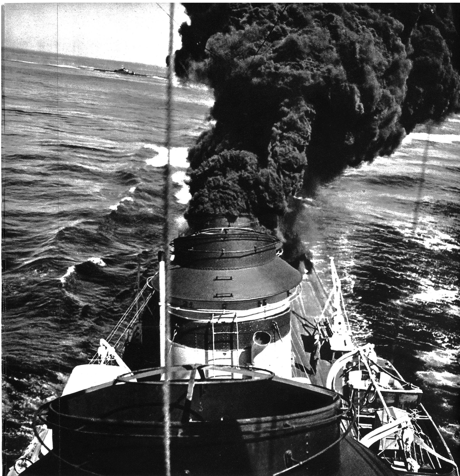
Mit Volldampf voraus

Einem unserer Mitarbeiter wurde die Erlaubnis gegeben, während der französischen Hochseemannöver auf dem Flaggschiff zu photographieren. Was er nach Hause brachte, geben wir hiermit unsern Lesern wieder, ihnen damit eine neue Welt erschließend. Leider eine Welt von Vernichtung und Tod. Was könnten mit den Milliarden, die von allen Staaten in die Hochseeflotten investiert werden, für Kulturwerte geschaffen werden! Erleben wir wohl noch einmal die Zeiten, wo die Völker zueinander wieder Glauben und Vertrauen fassen? Oder besteht der „Weltfriede“ in den ungeheuren Aufrüstungen?