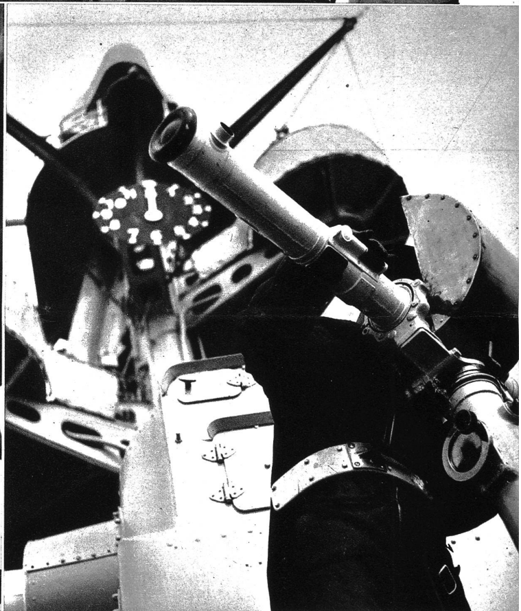
Am Entfernungsmesser wird die exakteste Arbeit verlangt