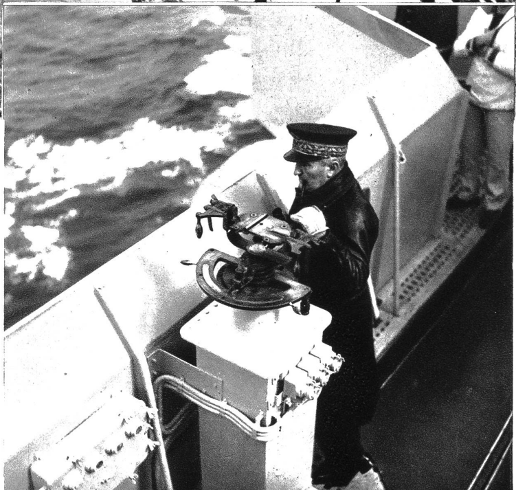
Auf der Kommando-Brücke des Flaggschiffes