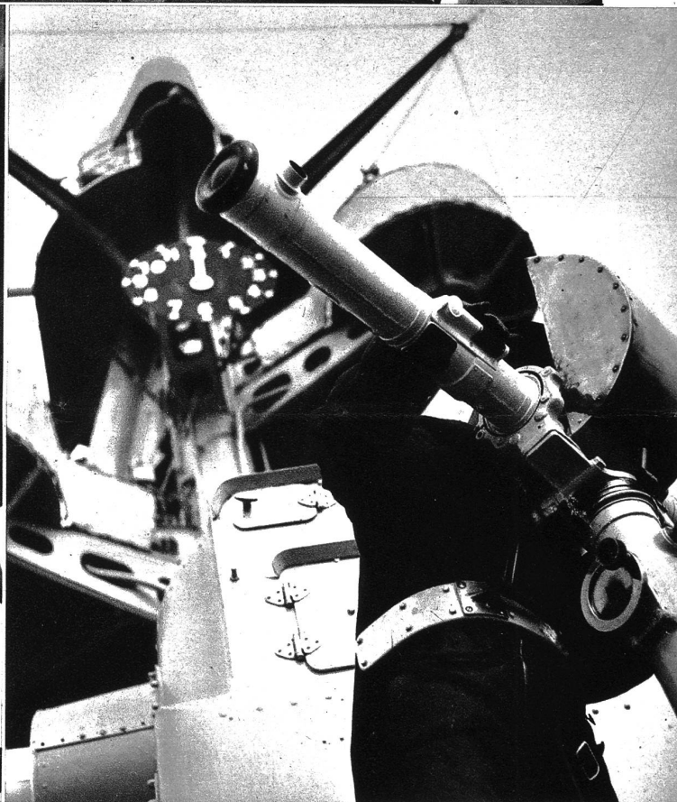
Am Entfernungsmesser wird die exakteste Arbeit verlangt