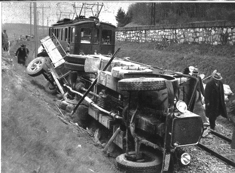
Die Reisenden konnten sofort durch Hilfszüge weiter transportiert werden.

Tirana, Albanien. Am 27. April fand in der albanischen Hauptstadt Tirana die Vermählung König Zogu's mit der ungarischen Gräfin Geraldine Apponyi statt. U. B. z. König Zogu mit seiner Braut Gräfin Geraldine Apponyi, bei dem Empfang im königlichen Palais in Tirana. Ganz links eine der Schwestern des Königs, Prinzessin Myzejen.